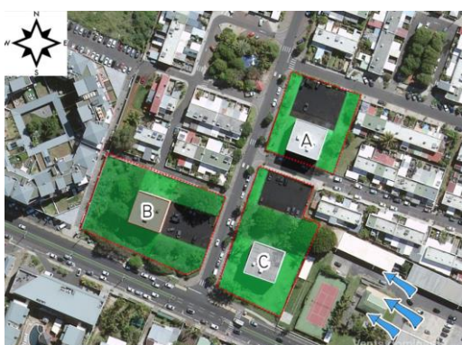
Figure 1 Vue en plan des bâtiments étudiés. Surfaces minérales en gris et végétalisées en vert.