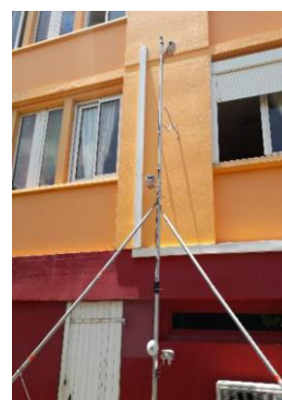
Figure 2 Mât autoportant comportant 3 niveaux de mesures, positionné au droit des façades.

Pour chaque scénario, nous avons comparé les données de rayonnement solaire global de chaque façade étudiée, hauteur par hauteur. Nous avons analysé l'évolution des écarts instantanés entre les rayonnements globaux mesurés, ainsi que l'évolution sur la journée des données de température d'air.