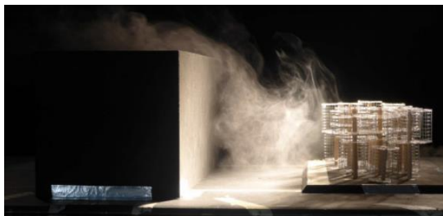
Figure 5 Essai en soufflerie pour détermination des coefficients de pression en façade en fonction d'un plot végétal. Incidence du vent 0°, végétation haute et basse à 12 m de distance.

Les 3 types de végétation ont été testés pour différents d'azimut du vent, et différentes distances de plots végétaux par rapport à la façade. Une configuration de référence qui représente le bâtiment sans présence de masse végétale a été étudiée.