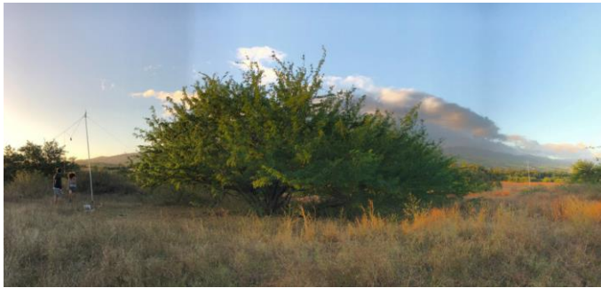
Figure 3 Caractérisation aéraulique d'un plot végétal haut

positionnée à 3m en aval du plot végétal, à 2 niveaux de mesures i1 et i2 . Les stations de mesures ont été positionnées de telle sorte que la direction du vent soit perpendiculaire à la largeur du plot végétal.