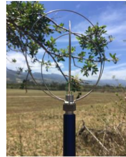
Figure 4 Anémomètre de précision utilisé pour la caractérisation des plots végétaux

Les mesures ont été analysées de façon adimensionnelle :