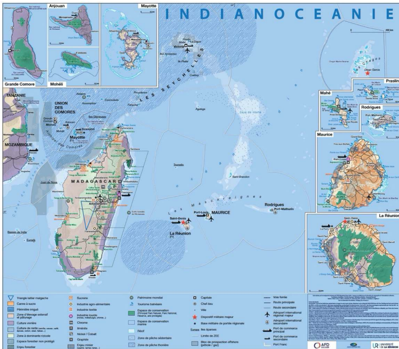
Figure 3. Carte de l'Indianocéanie réalisée pour l'Agence française de développement, 2018.

communicationnelle des explorations à la croisée, entre traduction et trahison, de la communication des sciences (Jacobi, 1999 ; Jurdant, 2009) et de l'inscription de ces dernières dans un espace de pouvoirs politiques et économiques (Pestre, 2010). Cette carte, produite en 2018 par les géographes du laboratoire OIES et du laboratoire de cartographie de l'UR à la demande de l'Agence française de développement, traduit la dynamique des explorations scientifiques telles que nous avons pu les décrire précédemment. On y retrouve les espaces insulaires du sud-est de l'océan Indien comme les marges est-africaines de ce dernier, ces bordures appartenant – il est intéressant de le souligner – à des pays continentaux non membres de la Commission de l'océan Indien.