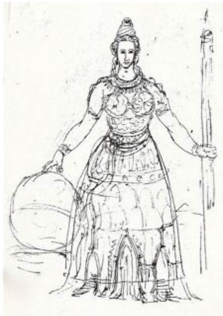
Figure II - J. Machereau, Le temple femme, dessin BA Ms 13910. D'après Antoine Picon, Les Saint-simoniens, raison, imaginaire et utopie , Paris, Belin, 2002.