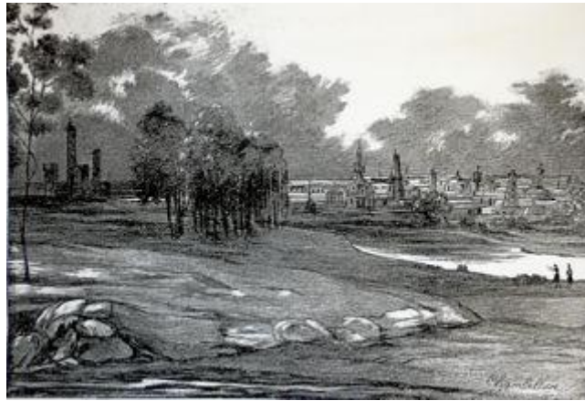
Figure I - La ville nouvelle de Saint-Simon, dessin de Chambellan, Le Charivari , 8 juin 1833.