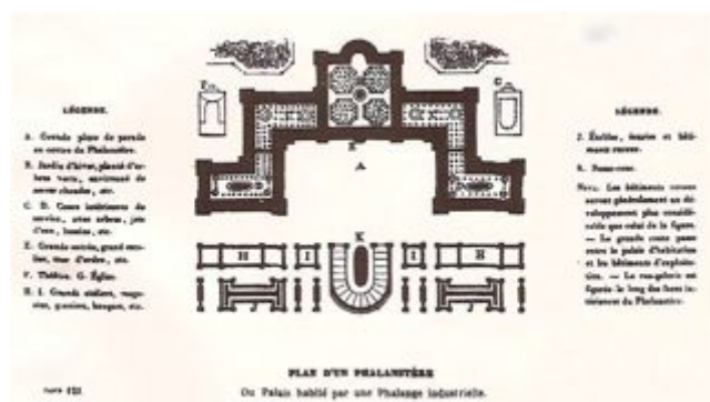
Figure 4 - Charles Fourier, Le nouveau monde industriel et sociétaire [1829-1830], Oeuvres complètes , Paris, Anthropos, tome VI, 1996.