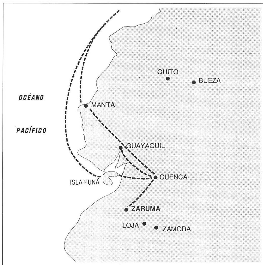
Ruta de la Trata hacia Zaruma. Proposiciones de los mineros (1592-1593)

roducción de esclavos en las minas, fueran de oro o de plata. En adelante, las proposiciones habían de girar alrededor de este espinoso problema de ramo de obra.