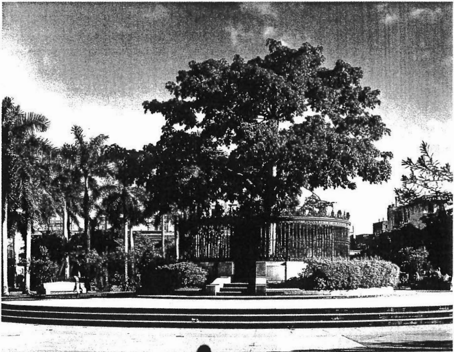
Seiba Pentandra, árbol de la fraternidad americana. La Habana

servil clandestina, que imposibilitaban los acuerdos firmados entre el gobierno metropolitano y el gabinete británico. De modo que lo del empadronamiento de los esclavos fue un cuento de nunca acabar. En rigor, no tenía interés el capitán general en reducir esta contradicción, máxime cuando estalló la guerra de diez años. No podía correr el riesgo de discontentar a los propietarios, a no ser que se tratara de proteger los fondos de la contaminación revolucionaria. Así que él también tuvo sus propias contradicciones.