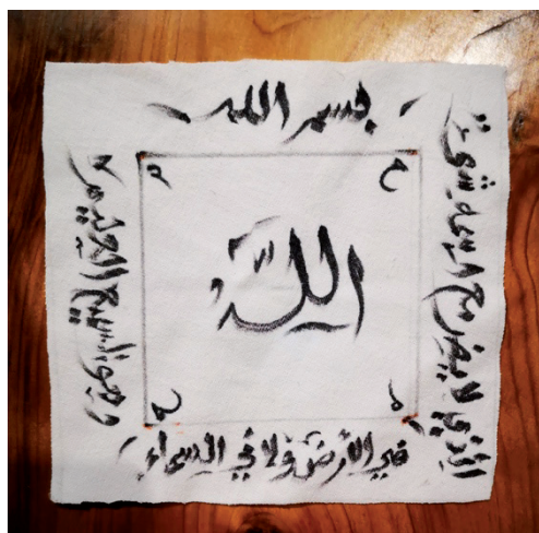
Fig. 2 : hirizi de protection contre la covid-19