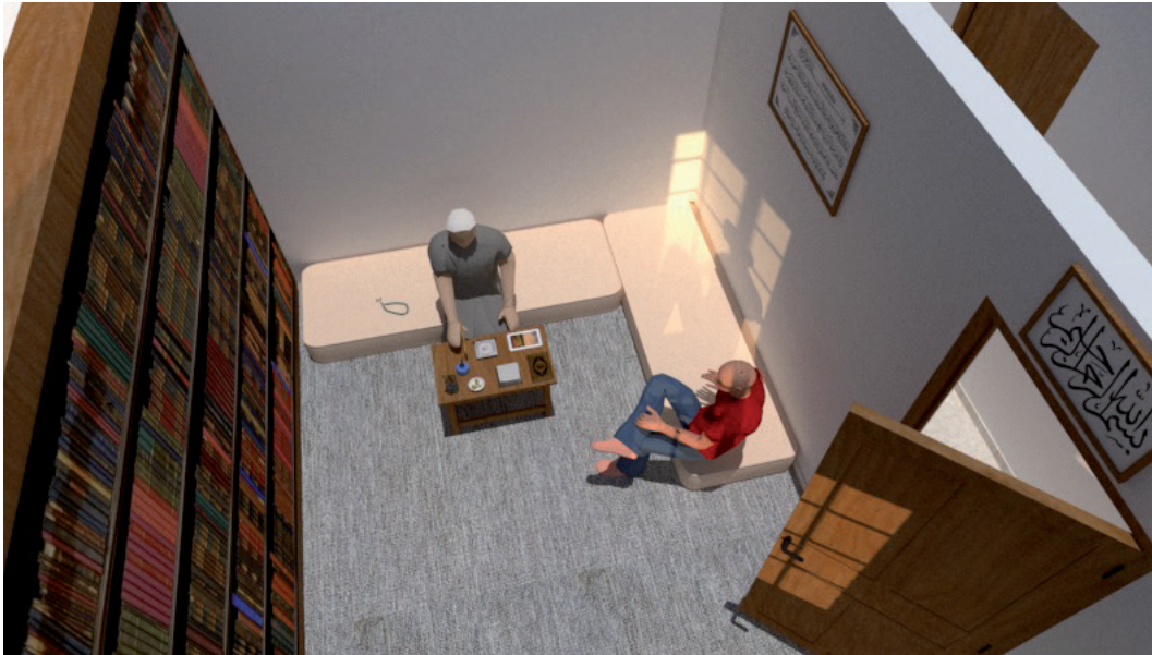
Fig. 1 : Le fundi Saïd et le chercheur durant une téléconsultation rituelle (logiciel SketchUp en accès libre)

du mal et que l’on ne voit pas ». Ces ablutions renvoient à une pensée analogique de pureté et de protection contre les invisibles et les nuisibles.