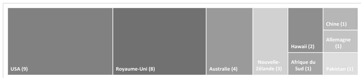
Figure 1 : Ancrage géographique par pays dans 46 rapports

L'analyse de l'ancrage géographique par pays amène deux constats : un ancrage géographique parfois inexistant ainsi que la place prédominante accordée aux berceaux de la langue anglaise que constituent le Royaume-Uni et les États-Unis. En effet, trente références sont faites à des pays (dans certaines séances, plusieurs pays sont mentionnés), et 22 séances ne sont ancrées dans aucun contexte géographique spécifique. Les USA (9 références) et le Royaume-Uni (8) devançant l'Australie (4), la Nouvelle-Zélande (3) et Hawaï (2).