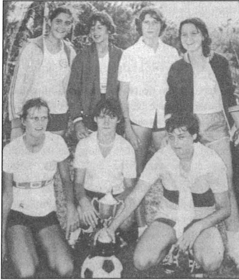
Élèves du Couvent de Lorette de Curepipe Week-End Sports Magazine 20 février 1980

établissements confessionnels catholiques avec quelques autres, publics ou privés, et que les premières places sont régulièrement obtenues par les collèges du Saint-Esprit et Saint-Joseph , pour les garçons, et par les Couvents de Lorette du plateau central, pour les filles.