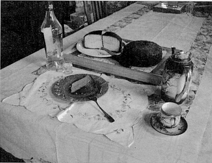
Portion de tourte prête à la dégustation accompagnée de son verre de liqueur (sur la gauche)

En effet les fours, qui se trouvaient dans certains quartiers seulement, n'étaient pas accessibles à tous. Et c'est le mode de cuisson à la braise qui a subsisté dans les branches descendantes de ma famille en ligne maternelle, qui aujourd'hui cuisinent encore la tourte. C'est aussi celui que j'ai adopté dans le cadre de mon expérience de revalorisation de ce patrimoine culinaire. Il s'agit de placer des braises ardentes sur le couvercle de la marmite et dessous la marmite, comme sur la photo.