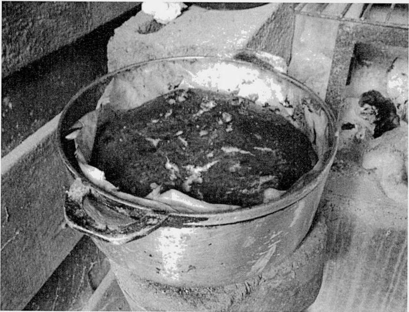
Tourte sortant de la braise

Le lendemain de toute cette préparation, lorsque la pâte à brioche a bien levé, autrefois on la plaçait dans des moules en fer-blanc, ou dans des grosses marmites en fonte, puis plus récemment on a utilisé celles en aluminium. On y déposait d'abord une couche de pâte, puis une couche de crème recouverte d'une nouvelle couche de pâte. On prenait soin de ne remplir que la moitié du moule afin d'éviter que la pâte ne déborde et se perde dans le feu, car sous l'effet de la chaleur, le levain continue d'être actif et de la « faire monter ». Mise ainsi en moule, aujourd'hui comme autrefois, la tourte est finalement dorée avec un jaune d'œuf soigneusement réparti sur toute sa surface. Ceci a pour effet de lui donner, à la cuisson, cette belle couleur vernissée que l'on observe sur la photo suivante.