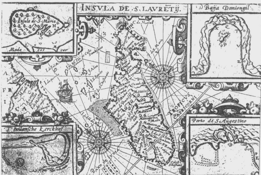
Histoire de la Navigation aux Indes orientale: par les Hollandais en 1655, p. 6 (verso).

Les ports les plus fréquentés par les Hollandais durant le premier siècle de la découverte de Madagascar :