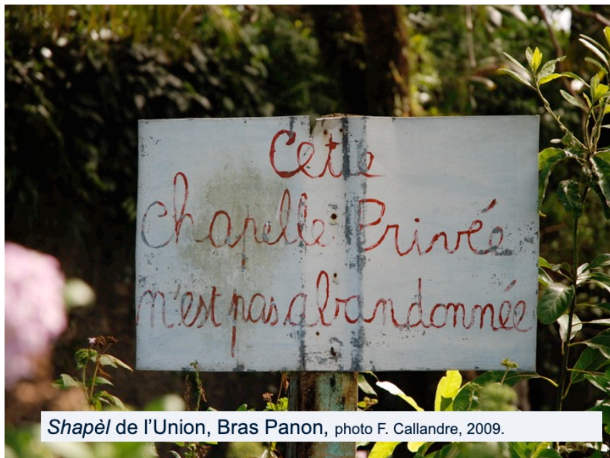
Shapèl de l'Union, Bras Panon, photo F. Callandre, 2009.