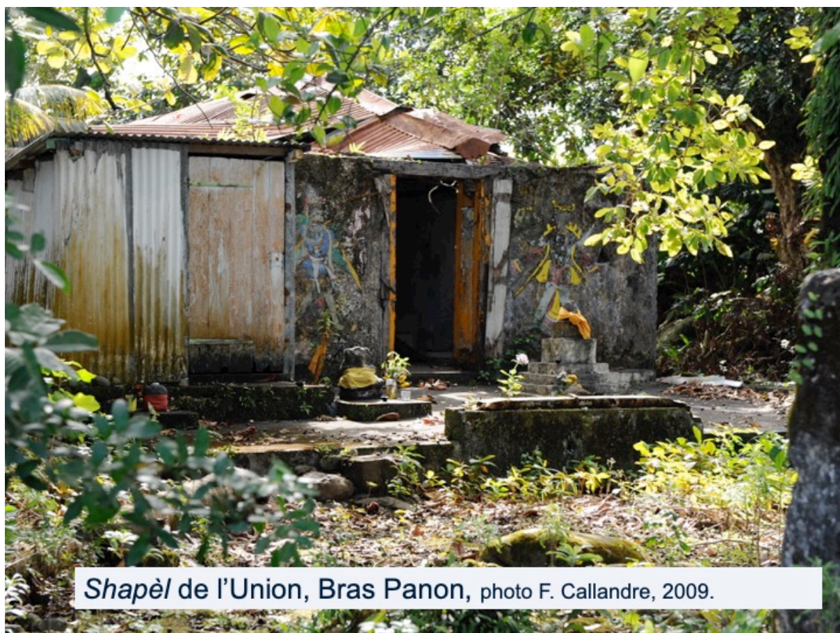
Shapèl de l'Union, Bras Panon