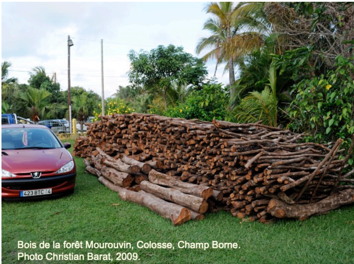
Bois de la forêt Mourouvin, Colosse, Champ Borne. Photo Christian Barat, 2009.