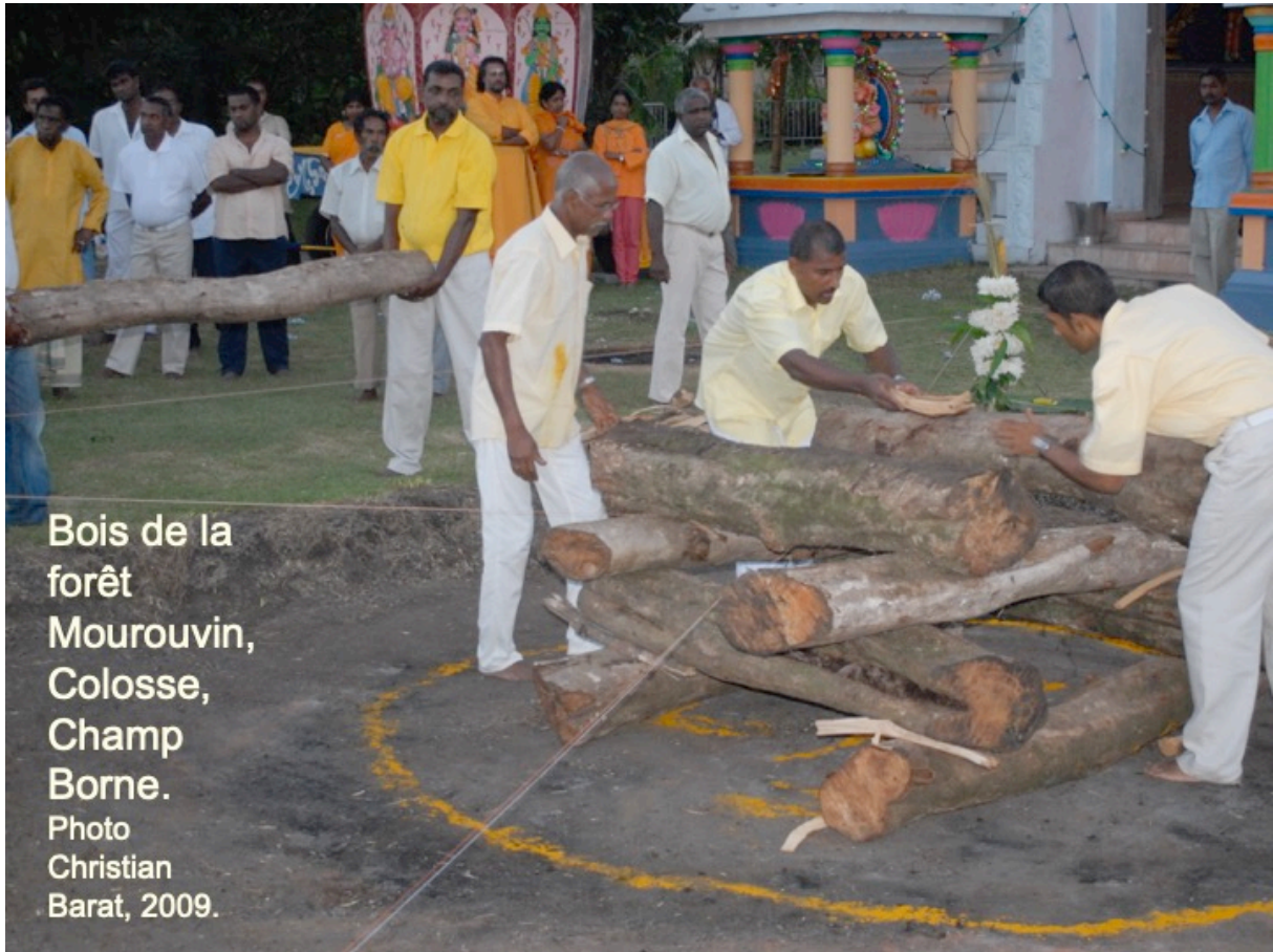
Bois de la forêt Mourouvin, Colosse, Champ Borne. Photo Christian Barat, 2009.