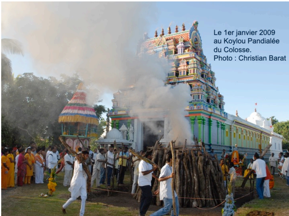
Le 1er janvier 2009 au Koylou Pandialée du Colosse.