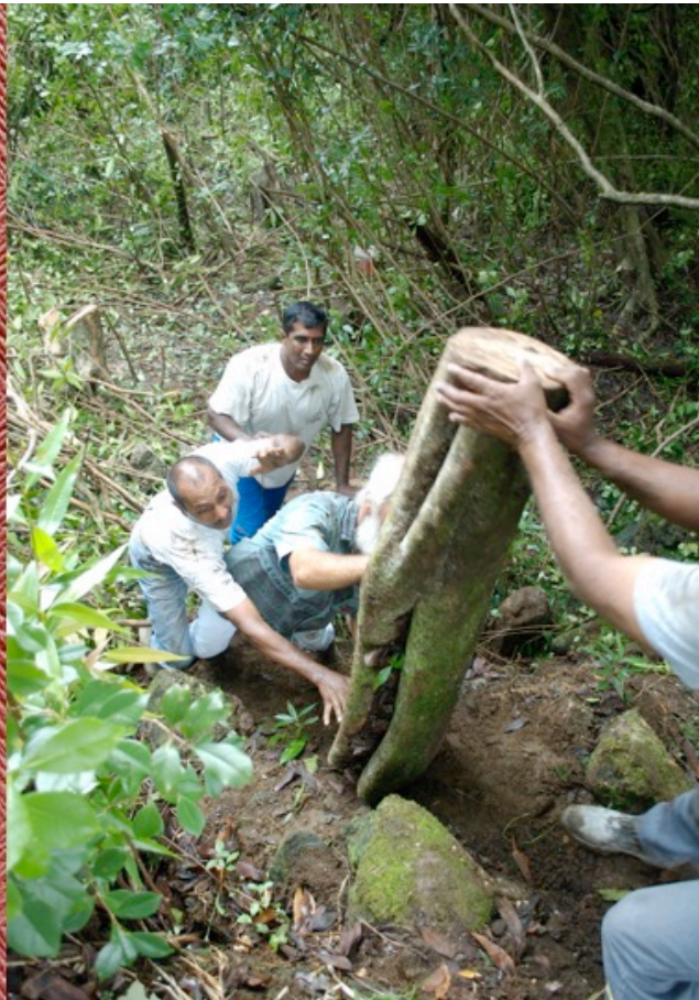
Décembre 2008

Découpage de bois dans la forêt Mourouvin pour la préparation de la marche sur le feu du koylou du Colosse.