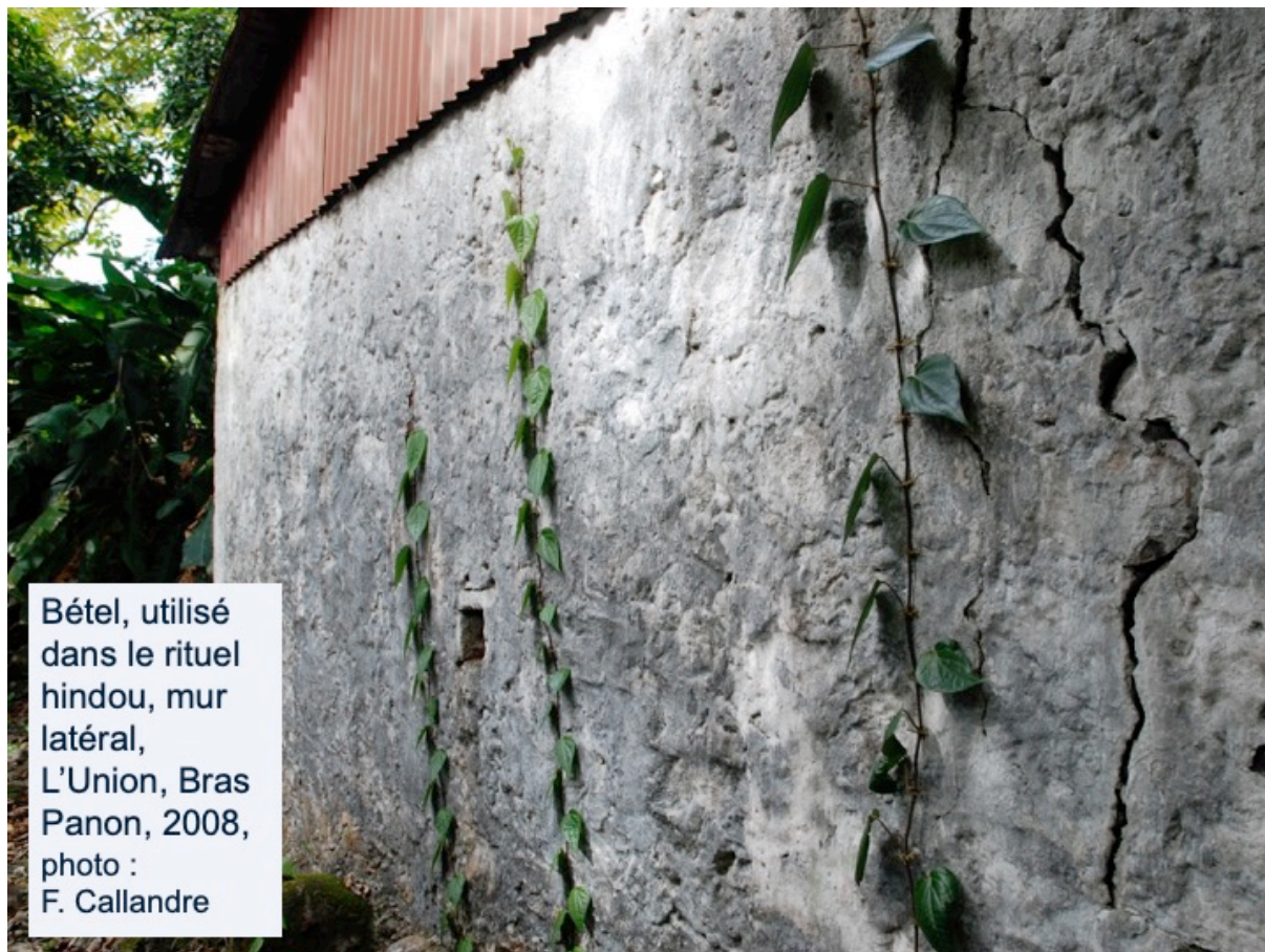
Bétel, utilisé dans le rituel hindou, mur latéral, L'Union, Bras Panon, 2008, photo : F. Callandre

Il reste un abri de bois sous tôle qui a fait l'objet d'une demande de classement par la DRAC mais dont le dossier est toujours en suspens. « De même qu'à Sainte Rose. Mais c'est à Sainte Rose surtout qu'il priait. Les vieux m'ont dit qu'il venait prier là. Il avait sa fille et son gendre qui étaient directeurs, ils travaillaient là et il priait là. Il disait toujours que la mère de son patrimoine c'était là-bas, Sainte-Rose. » (René Kichenin)