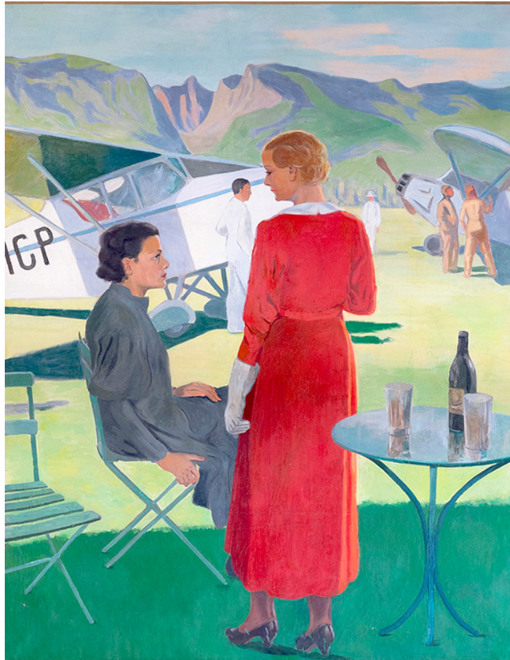
Fig. 10 : Maurice Ménardeau, « Le champ d’aviation », huile sur toile, 200 x 150 cm