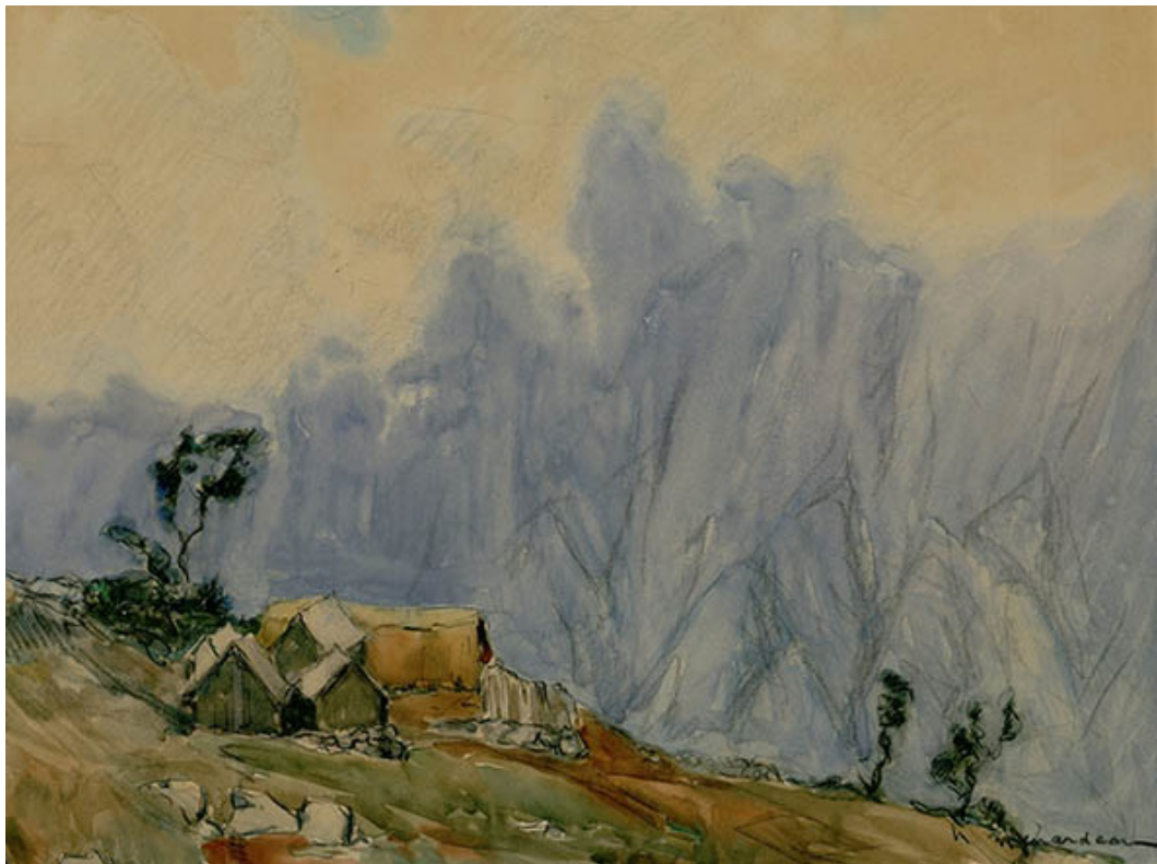
Fig. 5 : M. Ménardeau, « Îlet dans la montagne », aquarelle et fusain sur papier

Inv. 75. 9404, 31,3 x 40,3 cm, (don d'Ary Leblond), 1933 ou 1935, Maurice Ménardeau