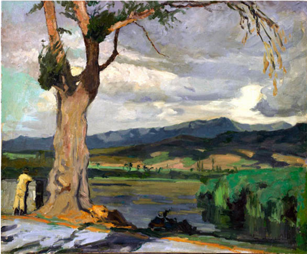
Fig. 4 : M. Ménardeau, « L'étang Saint-Paul », huile sur toile

Saint-Denis, musée Léon Dierx, inv. 1999.02.07, 53,5 x 63,5 cm, 1932 ou 1935