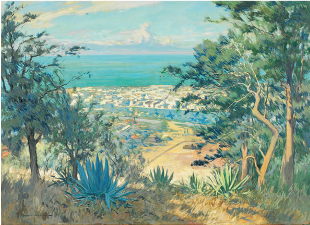
Fig. 8 : M. Ménardeau, « Rampes vers la ravine de Saint-Denis » huile sur isorel

Coll. de la mairie de Saint-Denis, 180 x 130 cm, 1935