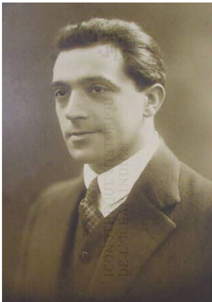
Fig. 1 : « Portrait de l'artiste », photo argentique, signé au dos, « Ménardeau artiste-peintre », 25,60 x 14,40 cm, 1926 (FMR)

Ce portrait, réalisé en studio, est daté et accompagné de la mention « artiste-peintre ». Sans doute destiné à un dossier officiel, l'artiste qui aborde la trentaine,