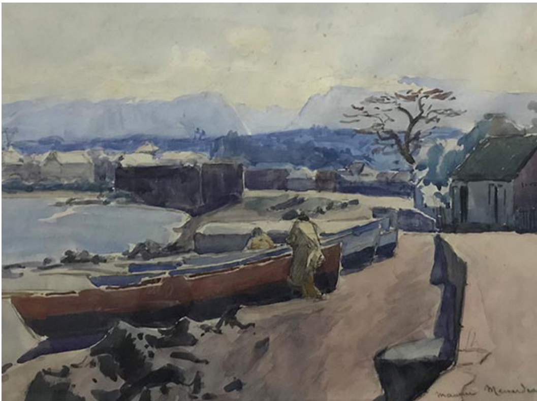
Fig. 7 : M. Ménardeau, « Les barques et pêcheurs à Saint-Pierre », aquarelle

Saint-Louis, musée du MADOI, inv. B. A., 995. 0978, 51 x 59,5 cm, 1933 ou 1935