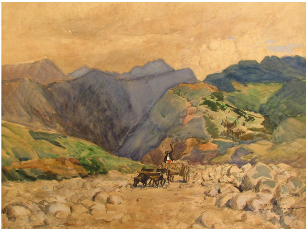
Fig. 2 : Maurice Ménardeau, « La Réunion », aquarelle sur toile, signée et datée en bas, à droite, accompagnée de la mention « La Réunion 1933 »

Port-Louis, MCB ( Mauritius Commercial Bank ), inv. 51 400, 48 x 60 cm, © Blue Penny Museum, 1933