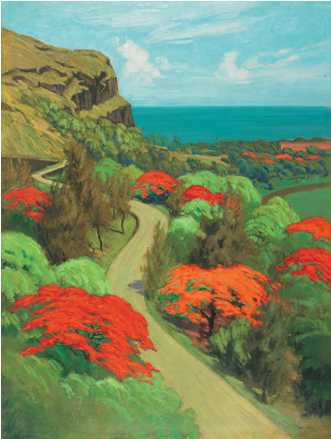
Fig. 9 : M. Ménardeau, « La route aux flamboyants », huile sur toile, 200 x 150 cm