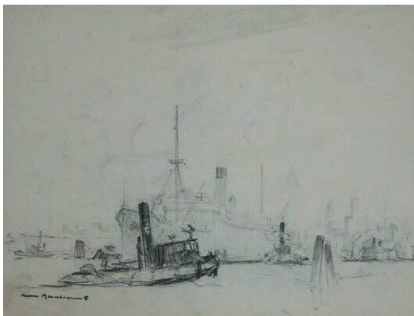
Fig. 6 : M. Ménardeau, « Le port de la Pointe-des-Galets », dessin à la mine de plomb

Saint-Denis, musée Léon Dierx, inv. 1999. 02. 01, 20,9 x, 26,8 cm, 1936