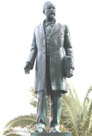
Statue de François de Mahy devant l'Hôtel de ville de Saint Pierre

On peut, au terme de cette étude, affirmer que le bilan de l'action de François de Mahy en faveur de son île est assez limité. Républicain fervent et très attaché à son île, il lui a appliqué des schémas de développement simplistes. Il voyait dans l'aventure coloniale la solution aux problèmes locaux. En tant que ministre, il n'a guère réussi à faire appliquer des mesures économiques, comme le soutien aux exportations de sucre de canne, en faveur de La Réunion. Il n'a pu faire appliquer des mesures en faveur du sucre réunionnais menacé par la betterave. Notre étude basée sur une première approche des papiers privés du député doit encore se poursuivre aux archives d'outre-mer à Aix en Provence. Cela permettra d'affiner notre analyse de l'action de celui qu'on a surnommé le « Grand Créole ». Il représente de façon très claire cette politique colonisatrice de La Réunion cherchant dans le cadre colonial le salut de Bourbon.