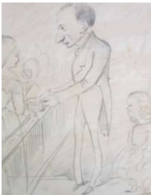
2. Gaudemar. Caricature par Grimaud Archives départementales de La Réunion, 3J1/51, Caricature Grimaud