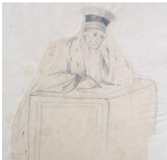
4. Barbaroux. Caricature par Grimaud Archives départementales de La Réunion, 3J1/51, Caricature Grimaud