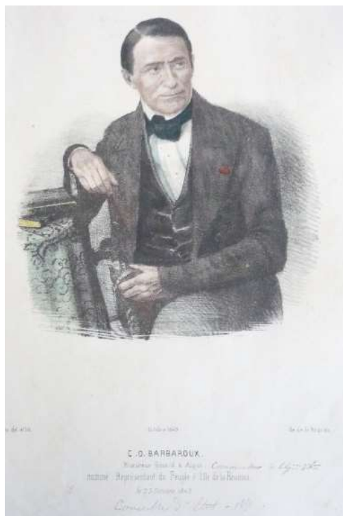
3. Charles Ogé Barbaroux. Album Roussin