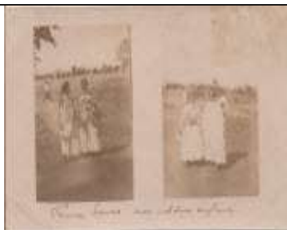
Femmes hova sans enfants