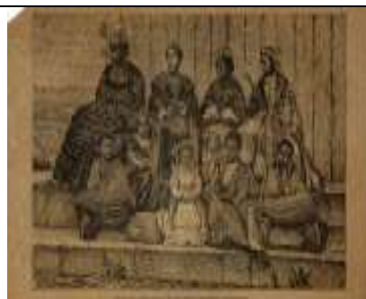
Type de hova nobles lors de leur communion