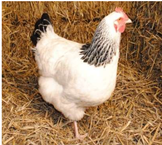
Race américaine: Rhode Island .

Bonne pondeuse et couveuse : Poule Sussex (américaine)