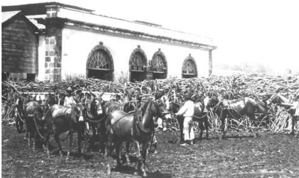
Mules attelées à une charrette et livrant leur chargement de cannes à la sucrerie de Grand-Bois

Poitou 958 ), plus fortes, d'importation plus aisée et moins chères, qui constituent l'essentiel des ateliers sucriers réunionnais. Ces draft mules comme on les appelle, ou mules de trait lourd (pesant entre 540 et 730 kg), sont particulièrement aptes aux climats chauds, c'est pourquoi elles sont préférées aux autres dans les entreprises d'émigration et de colonisation.