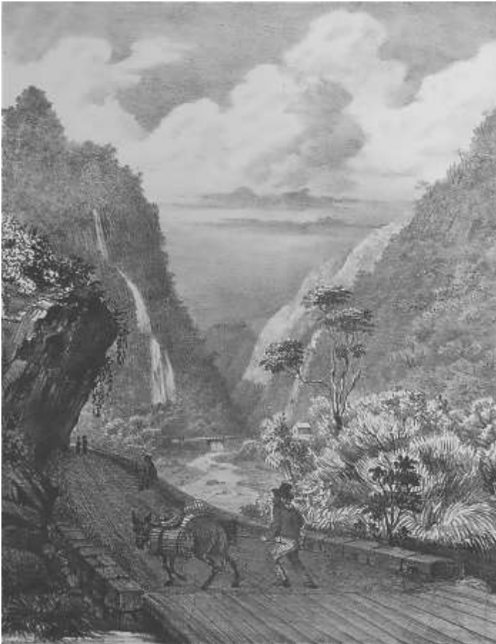
Doc. 6 : Mule transport des marchandises en direction de Salazie

L'exploitation de cette base de données permet d'avoir une idée de ce que ces sources peuvent apporter à la connaissance du cheptel et de son importance sur des propriétés dont l'activité agricole est fortement dominée par la culture de la canne. Que nous apprennent les sources notariées ? Le cheptel sucrier est très largement dominé par ce que l'on pourrait qualifier le « gros cheptel », principalement de bât ou de trait. Mules et muets constituent une part importante de ce cheptel.