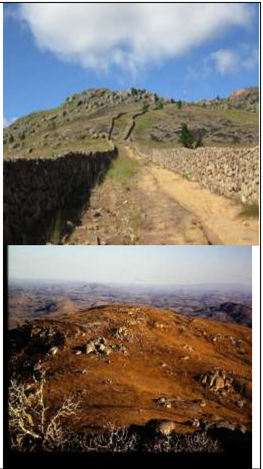
Le site en photos : en haut, le site princier ; en bas, le site à grand parc