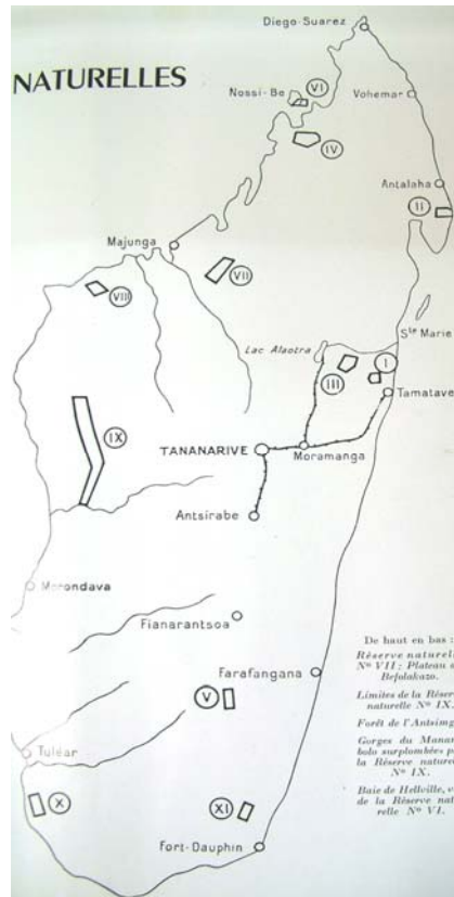
Revue de Madagascar , n° 8, 1 er trimestre 1950, page 23

Les choses vont donc relativement vite à Madagascar. Il faut je crois insister sur cette temporalité. En effet la situation coloniale simplifie les choses, au moins dans deux registres :