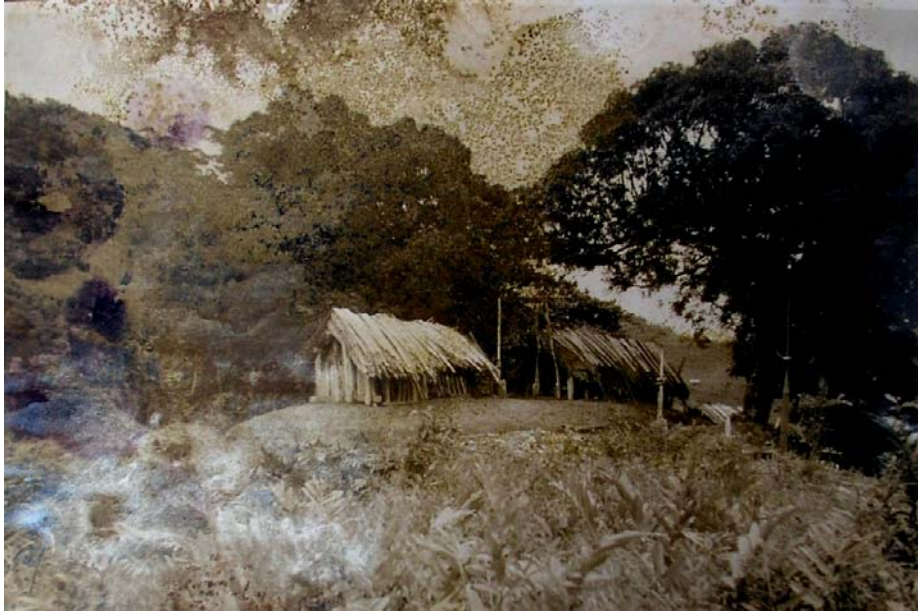
Cimetière betsimisaraka, Andondabe, Photographie de Decary (mauvais état de conservation) Partie ethnographique du rapport (ARM, D54)

L'idée que l'on ait pu traverser des zones de nature intacte est une dernière fois ébranlée par la rencontre d'un commerçant chinois, preuve d'un espace déjà structuré et organisé en matière de commerce. Cette rencontre est l'occasion d'un véritable exercice de style autour des a priori coloniaux à propos des Chinois. Il faut se méfier de l'obséquiosité des dits commerçants et refuser tout éventuel petit cadeau, qui ne peut être que preuve de leur fourberie !