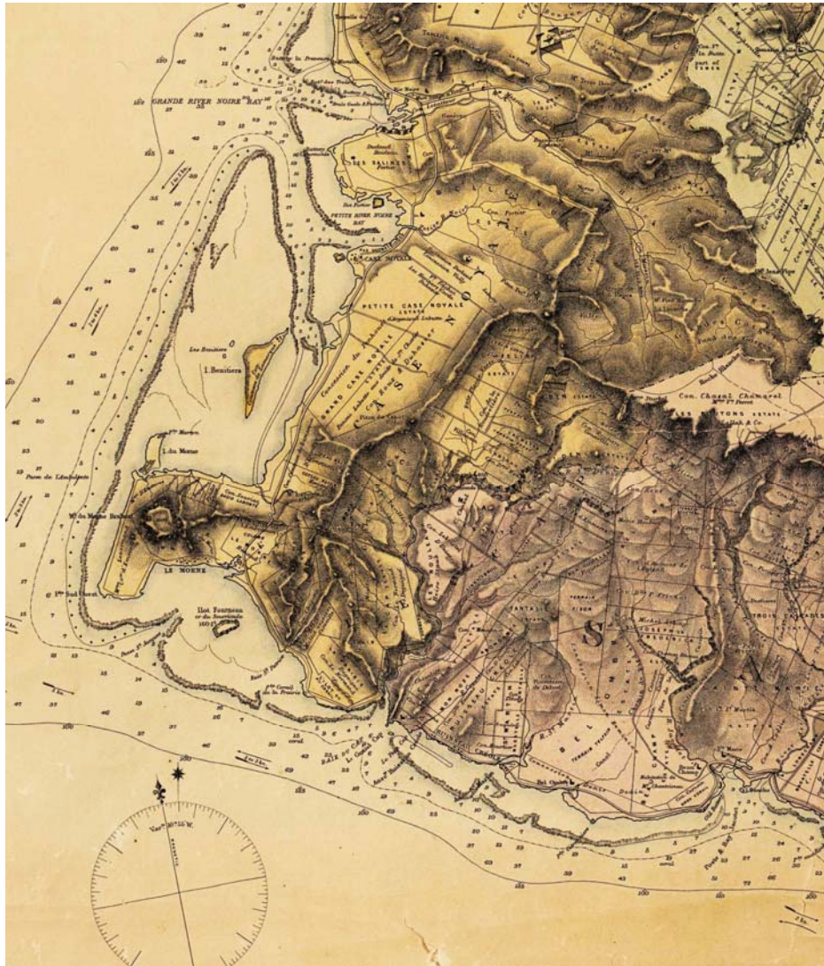
Carte 1 : le secteur de la Rivière des Citronniers et du Poste Jacotet

La société obtint à peu de distance des bords de la mer six terrains d'habitation « en consentant la réunion au domaine d'une pareille quantité de terre en d'autres quartiers ». Estienne Boldger décrit les lieux comme étant une petite plaine sablonneuse, dépouillée de bois près du bord de la mer. Ses premiers soins furent d'assurer « la subsistance de sa peuplade ». Il commence à pratiquer des cultures puis établit une communication entre ce champ et la mer car la voie maritime était le seul moyen de communiquer avec le chef-lieu de la colonie, « le défaut de chemin rendant le transport