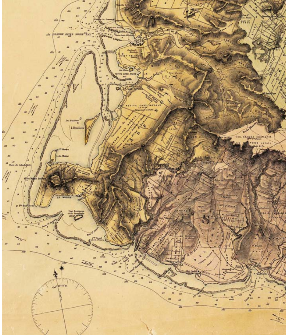
Carte 1 : le secteur de la Rivière des Citronniers et du Poste Jacotet