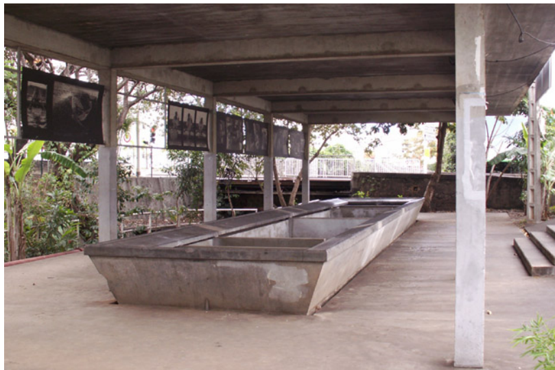
Lavoir de la Providence, près le Ruisseau des Noirs

Mais aussi dans la zone du Bas de la Rivière, pôle de l'industrie agro-alimentaire dès la seconde moitié du XVIII e siècle, où se regroupent ensuite une usine de transformation de l'aloès, un abattoir – dès 1828, sous l'impulsion du gouverneur de Cheffontaines, situé à l'embouchure de la rivière Saint-Denis – une féculerie, une distillerie, une fabrique à tabac, une unité de production d'électricité dans les années 1920, etc., pour commencer sur l'ancienne chocolaterie ; dans celle du marché où se dressaient les Étuves à blé, bâtiment de bois construit par de Crémont en 1772, pour étuver les blés que Bourbon produit en abondance et sont surtout exportés à l'Île de France. Dans la zone de l'ancien lavoir, à l'image du travail conduit au Cap par Élisabeth Grzymala Jordan 372 , où pourraient être mis au jour les artefacts composant la « signature matérielle du lavage » : boutons 373 , épingles, canifs, pièces de monnaie, petits objets culturels (chapelets, croix, autres) menus bijoux (bagues, bracelets, pendentifs et boucles d'oreilles), etc.