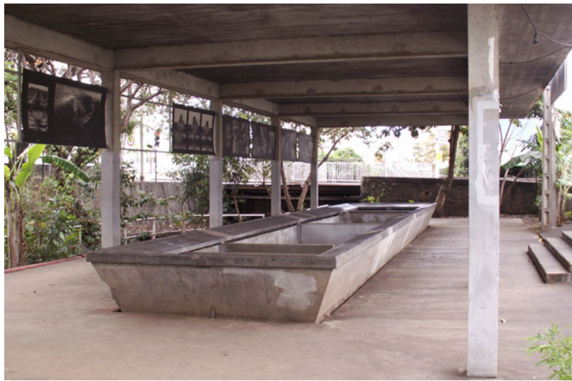
Lavoir de la Providence, près le Ruisseau des Noirs

Mais aussi dans la zone du Bas de la Rivière, pôle de l'industrie agro-alimentaire dès la seconde moitié du XVIII e siècle, où se regroupent ensuite une usine de transformation de l'aloès, un abattoir – dès 1828, sous l'impulsion du gouverneur de Cheffontaines, situé à l'embouchure de la rivière Saint-Denis – une féculerie, une distillerie, une fabrique à tabac, une unité de production d'électricité dans les années 1920, etc., pour commencer sur l'ancienne chocolaterie ; dans celle du marché où se dressaient les Étuves à blé, bâtiment de bois construit par de Crémont en 1772, pour étuver les blés que Bourbon produit en abondance et sont surtout exportés à l'Île de France. Dans la zone de l'ancien lavoir, à l'image du travail conduit au Cap par Élisabeth Grzymala Jordan 372 , où pourraient être mis au jour les artefacts composant la « signature matérielle du lavage » : boutons 373 , épingles, canifs, pièces de monnaie, petits objets culturels (chapelets, croix, autres) menus bijoux (bagues, bracelets, pendentifs et boucles d'oreilles), etc.