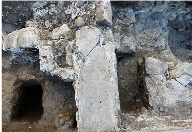
Diagnostic/sondage dans la cour de la prison

Les sondages totalisent une surface de 115 m 2 , soit 2,7 % de la surface totale du terrain 365 . Ils ont tous livré des vestiges de sols et de structures (murs, trous de poteaux) des XVIII e et XIX e siècles, ainsi que des éléments mobiliers (céramique, verre, métal), contemporain de l'utilisation du secteur comme tribunal avant son déménagement dans la première moitié du XIX e siècle. Même si les bâtiments anciens dont les vestiges ont été mis au jour ont été démolis au milieu du XIX e siècle (1846), leurs fondations, ainsi qu'une partie des élévations, sont conservées enfouies, avec les sols associés qui renferment du mobilier archéologique.