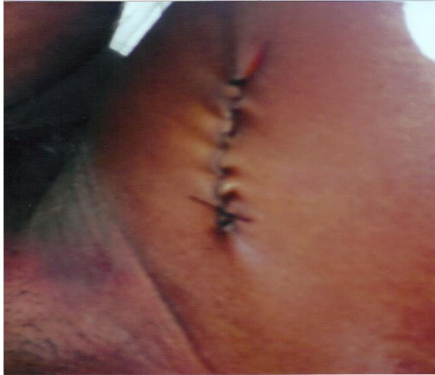
Doris sans langue avec un trou au niveau de la tête Doris sans organe