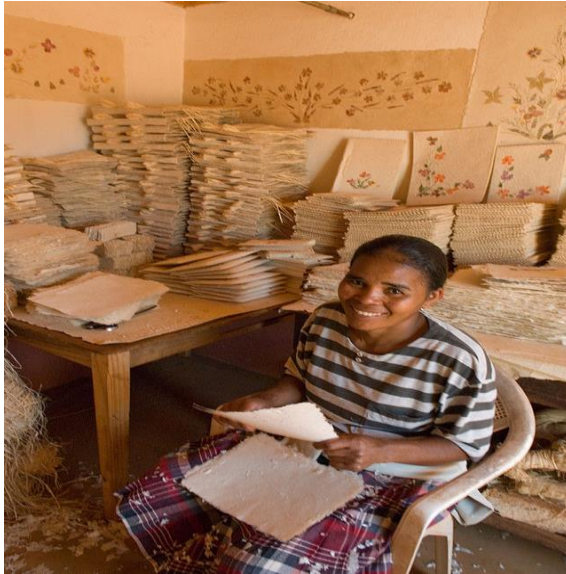
Une femme travaillant sur le papier Antemoro