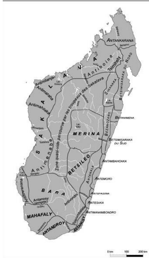
Répartition des 18 groupes ethniques à Madagascar selon Grandidier (1908)