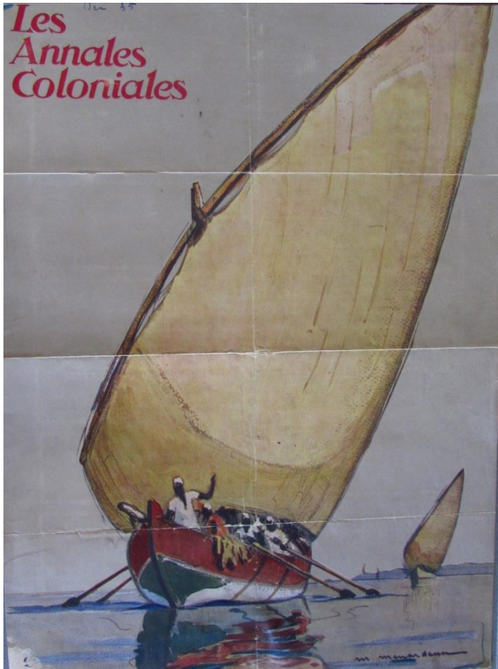
Fig. 3. Maurice Ménéardeau, « En mer Rouge », illustration des Annales Coloniales , septembre 1933, © coll. privée Ménéardeau/Rivière.

Salon des Indépendants. Il est également présent au Palais de la Porte Dorée, à Vincennes, pour l'Exposition coloniale de 1931. En bref, Ménéardeau est reconnu depuis la fin des années vingt comme un « peintre de la mer » auprès de « L'École de Concarneau », ce mouvement artistique qui regroupe des peintres français et étrangers depuis 1870 et qui s'est installé dans ce village de pêcheurs bretons. Il continue à naviguer régulièrement dans le cadre de « voyages d'études » et de « missions de propagande » de 1932 à 1940 : en mer Rouge, à La Réunion, à l'Île Maurice, sur la côte de Somalie, aux Antilles françaises, mais aussi en Indochine, en Chine et au Japon. Pour la revue des Annales Coloniales , il peint plusieurs couvertures de scènes maritimes (Fig. 3.).