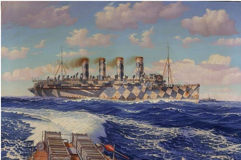
Fig.6. Burnell Pool, « Le Mauretania en Dazzle Painting », huile sur toile, Liverpool, Merseyside Maritime Museum, 1920.