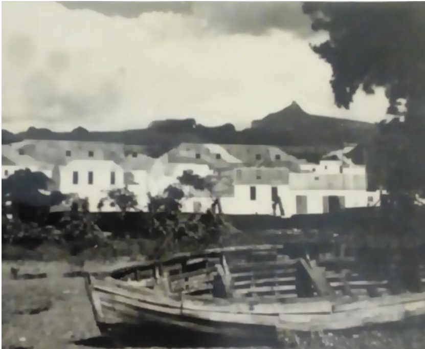
Fig.9. Maurice Ménéardeau, photo N/B, vue rapprochée du « village de pêcheur avec un canot », © coll. privée Ménéardeau/Rivière, 1940.

Ce faux village de pêcheurs est un tour de force de la part de Ménéardeau et de son équipe. Il précisera, dans ses archives personnelles, qu'il n'a pas été rémunéré et qu'il l'a fait dans un but patriotique.