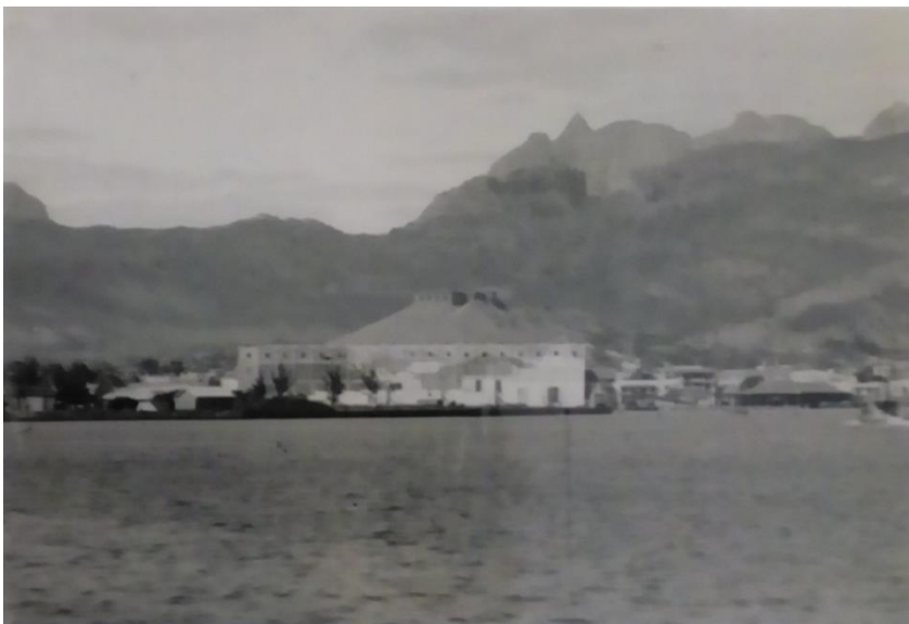
Fig.8. Maurice Ménardeau, photo N/B, « Le silo maquillé », © coll. privée Ménardeau/Rivière, 1940.

La première photo offre une vue d'ensemble de l'édifice, « maquillé » pour ne plus être identifiable en tant que silo. Ménardeau a utilisé de la peinture claire pour cacher la masse rouge des briques et faire ressortir les maisons et les arbustes du prétendu village de pêcheurs comme dans un décor de théâtre.