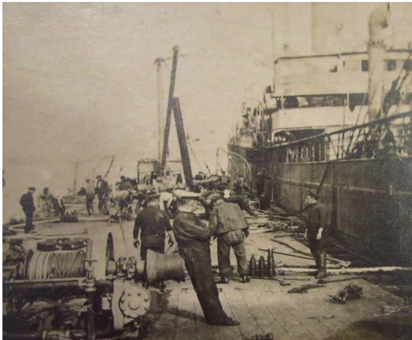
Fig. 2. Le cargo « Le Kuang-Si à quai», photo N/B.

Durant cette seconde halte forcée, en dehors des joyeuses bordées dans le port anglais, Ménardeau va occuper son temps à dessiner et à peindre au musée des beaux-arts de Cardiff. Sa vocation se précise : il sera peintre.