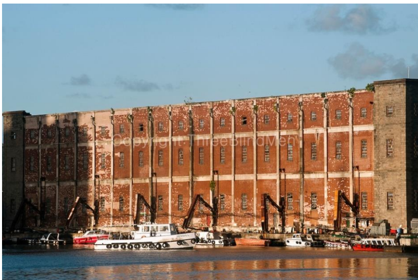
Fig.7. The Old Granary Building, Ile Maurice, Port-Louis, © Dominic Sansoni, Three Blindmen Photography . [s. d]

Soucieux de son approvisionnement, le gouverneur de la colonie britannique mauricienne décide, en 1926, de construire un silo à grains pour assurer le ravitaillement de la population en riz, farine et sucre. Il est érigé en briques rouges sur le site dit de la Pointe-des-Forges, à l'entrée du port. Le chantier dure trois ans pour aboutir à la construction d'un bâtiment de 8 000 m 2 pourvu de deux étages, inauguré en 1931. Il devait être le plus grand silo construit dans l'océan Indien. Cette sage précaution insulaire de pourvoir au stockage des denrées importées, à l'abri des intempéries et des nuisibles, s'avéra indispensable dès le début du conflit de la Seconde Guerre mondiale. Les navires des Messageries Maritimes suspendent leurs lignes de cargos et de paquebots vers Maurice qui se retrouve coupée de Madagascar et de l'Europe. L'Ile, désormais privée de toute information et de ravitaillement, vit en plus dans la menace de bombardements japonais (Fig. 7).