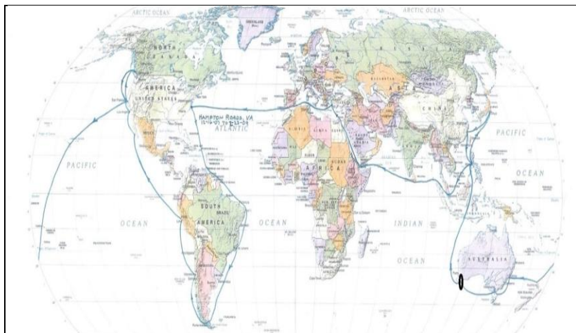
Document 2 : Albany, une étape importante de la croisière avant les Philippines

Mais contrairement aux fastes de la réception de la flotte américaine à Sydney ou Melbourne, souvent décrits, l'étape d'Albany en Australie-Occidentale demeure largement ignorée des historiens 232 , au mieux, à peine mentionnée. Après tout, l'intérêt de stationner ici n'était-il pas l'ennuyeux ravitaillement en charbon des seize imposants navires? 233 Mais ce facteur de la logistique était justement d'une importance cruciale si l'on considère les distances à parcourir entre le Pacifique Sud et les Philippines (document 2).