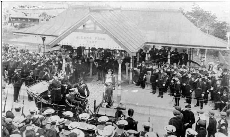
Document 4 : La réception officielle à la rotonde de Queen's Park

premières salutations et l'arrivée de la flotte aux autorités et à la population. Le Premier de l'Etat d'Australie-Occidentale, N. J. Moore rendit officiellement son salut à l'amiral Sperry en hissant le drapeau. Le Maire de la Ville d'Albany invita chaque citoyen à ouvrir ses portes aux marins étrangers et lança le programme des festivités dont le banquet fut certainement un point d'orgue, sans oublier la parade dans la ville de 2 500 marins américains 245 ou la réception à la rotonde de Queen's Park 246 (document 4). Après une semaine alternant célébrations festives, repos des marins et chargement du charbon dans les navires, le 18 septembre, la Grande Flotte américaine quitta Albany et adressa un dernier au revoir à l'Australie. Respectueux des consignes, l'Amiral Sperry avait été d'une grande prudence dans ses discours en omettant toute référence aux tensions dans l'aire pacifique 247 ... Ces sombres pensées étaient pourtant dans la tête de chaque Australien.