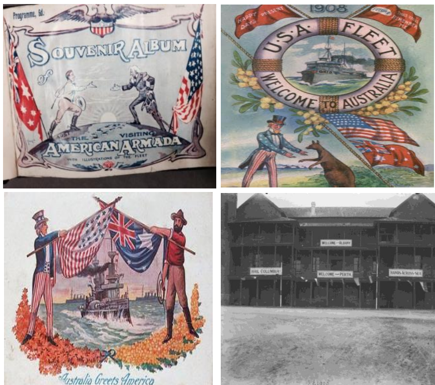
Document 6 : Entre l'Australie et l'Amérique, « des mains tendues »

nous chercheront des querelles après demain » 265 . Jamais la solidarité anglo-saxonne n'avait semblé s'exprimer de manière aussi forte qu'entre 1907 et 1908. Ces mains tendues par-delà la mer, cet élan de solidarité entre les deux nations, on le retrouve dans l'iconographie entourant l'événement (document 6) : cartes postales, publicités, affiches, brochures, albums... mais aussi ici à Albany, sur l'inscription placardée sur la façade de la poste, « Hands across the Sea » 266 , des mains tendues par-delà la mer.