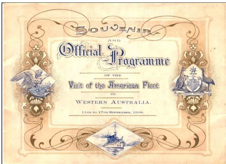
Document 3 : Le programme officiel de la réception (Perth, Sands & McDougall, 1908)

guerre stationnant dans la baie, le discours officiel de bienvenue 239 , le concert en plein air, des visites de la Capitale de l'Etat 240 et du bassin minier 241 , et l'annonce du grand bal de l'Hôtel de Ville le 16 septembre. Un beau programme et comme le relevait un correspondant de presse américain : « Albany a ses hourras et pour une petite ville, ils résonnent autant que ceux des grandes villes » 242 . Néanmoins, le 11 septembre au petit matin, très peu de « hourras », 243 car il n'y a que quelques spectateurs pour accueillir les visiteurs dans le port d'Albany en raison du fait qu'on ignorait l'heure d'arrivée de l'armada. Des manœuvres navales tenues secrètes, conduites en haute mer jour et nuit entre Melbourne et Albany, étaient à l'origine de cette imprécision dans l'agenda de la flotte 244 ... un flou volontaire donc.