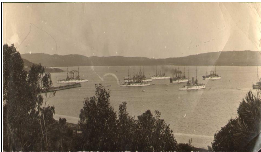
Fig. 1 : Cliché de la baie d'Albany pris lors de la visite de l'Armada.

Le 11 septembre reste un jour singulier dans l'histoire de l'Australie Occidentale. Il y a 110 ans, le 11 septembre 1908, la ville d'Albany ( Western Australia ) accueillait The Great White Fleet , la puissante flotte de guerre du Président américain Théodore Roosevelt. Jamais dans toute son histoire l'océan Indien n'avait connu une telle armada, une telle démonstration de force navale. L'évènement dans la petite ville côtière d'Albany, 3 600 habitants, ne pouvait passer inaperçu : seize navires de guerre, de construction récente, seize monstres de métal peints en blanc pour l'occasion, emportant à bord près de 14 000 marins, formaient dans la baie selon les témoins « le plus grand spectacle sur terre ». Après Sydney et Melbourne, Albany était la dernière étape australienne d'une croisière sur les océans inaugurée neuf mois plus tôt dans l'Atlantique, en Virginie, à Hampton Roads, le 16 décembre 1907. Albany offrit son hospitalité et surtout sa large baie de King George Sound , un site naturel opportun pour accueillir des navires de cette envergure en raison de la profondeur de ses eaux ; des clichés d'époque témoignent en effet d'une telle prédisposition (document 1).