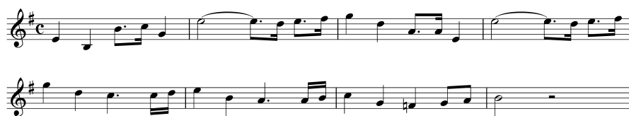
Ex. 1 : Motif de la marche des chevaliers

Ce « motif de l'épée » est entendu à l'orchestre, harmonisé en fa mineur, aux cordes graves seules puis aux cordes et aux cuivres (ex. 2) au moment où Merlin enjoint Mordred et Arthur de prouver leur légitimité en s'emparant d'Excalibur. De