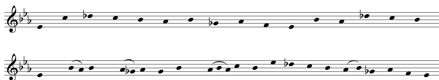
Ex. 5 : La mélodie liée à la présentation de la lance sanglante dans Perceval le Gallois

Parmi les – rares – films dont le parti pris « archéologique » tient de la revendication esthétique, deux œuvres s'imposent, tout en proposant des partis pris fort différents : Perceval le Gallois 16 et Blanche . Éric Rohmer, dans le premier, joue sur deux tableaux. Le film, qui donne à entendre de larges extraits du Perceval de Chrétien de Troie, fait appel à des musiciens jouant réellement sur le tournage des mélodies dans lesquelles on reconnaît des formules issues de la lyrique profane 17 et sur lesquelles les acteurs psalmodient le texte ou qui fournissent le point de départ d'improvisations telles que l'on peut parfaitement imaginer qu'elles aient été couramment pratiquées, même si la tradition manuscrite ne les a pas conservées. Un exemple parmi d'autres intervient lors de l'apparition du chevalier portant la lance sanglante puis de la jeune fille portant le graal, alors que Perceval séjourne chez le roi pécheur : on entend alors une mélodie à l'orgue en mode de ré transposé sur mi bémol et construite à partir de formules issues du répertoire du plain-chant. La pratique du bourdon (la mélodie évolue sur une longue note tenue, un mi bémol) finit de camper la musique dans la période (ex. 5).