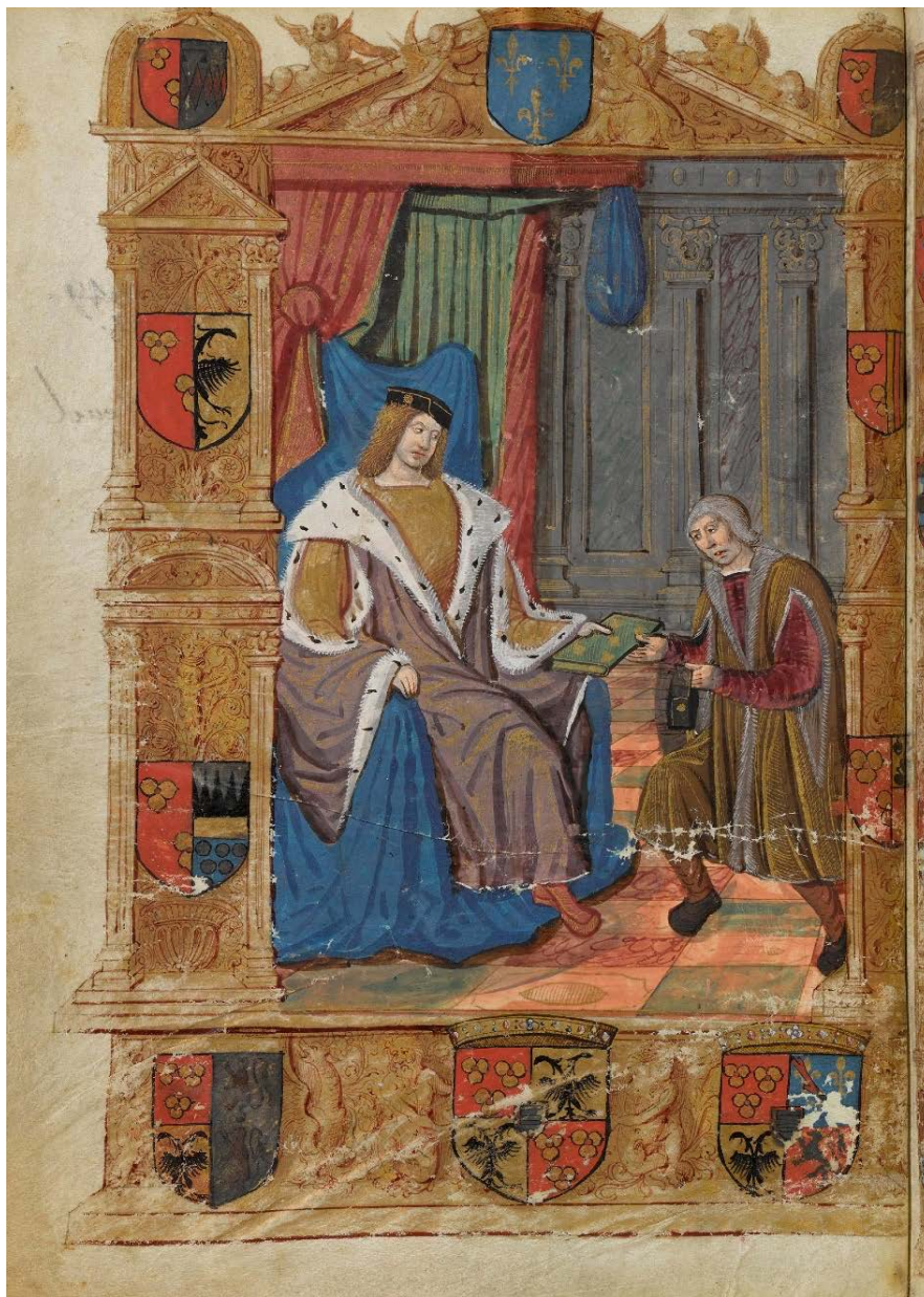
Ill. 1 : Frontispice - premier volet (présentation du livre) ; BnF, fr. 1473, fol. non numéroté