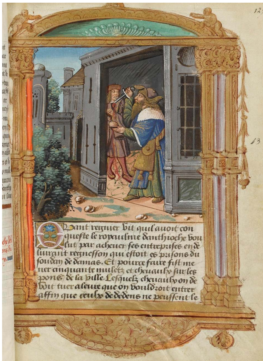
Ill. 6 : Le soudan de Damas assassine un écuyer ; BnF, fr. 1473, fol. 127