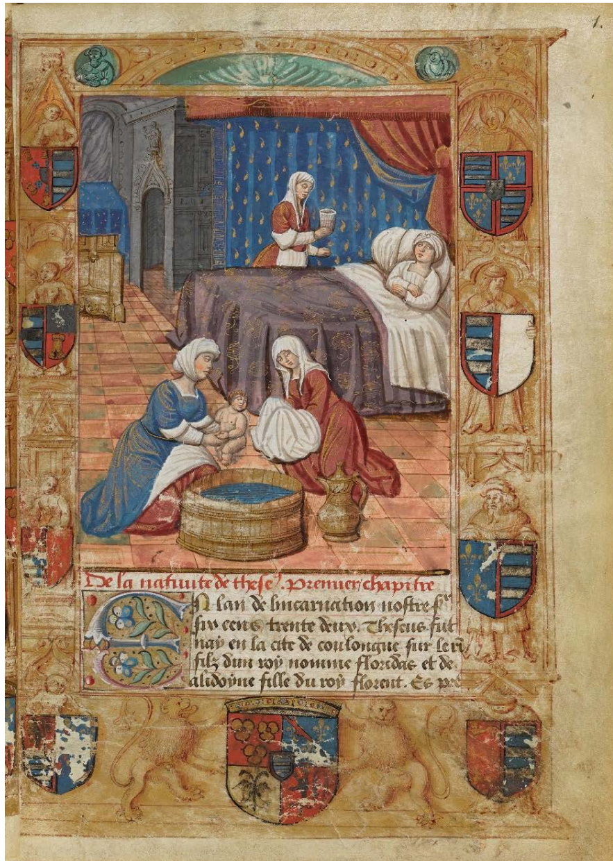
Ill. 2 : Frontispice - second volet (nativité de Théséus) ; BnF, fr. 1473, fol. 1