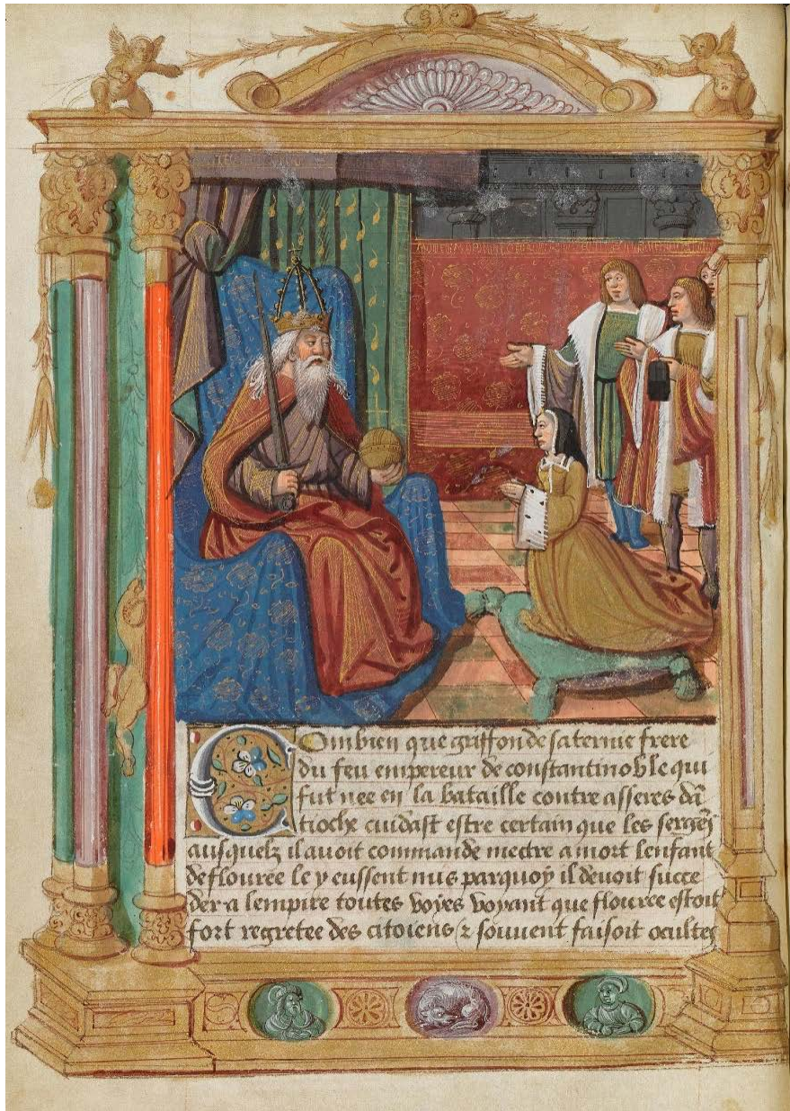
Ill. 3 : Le retour de Flore à la cour de son père ; BnF, fr. 1473, fol. 18