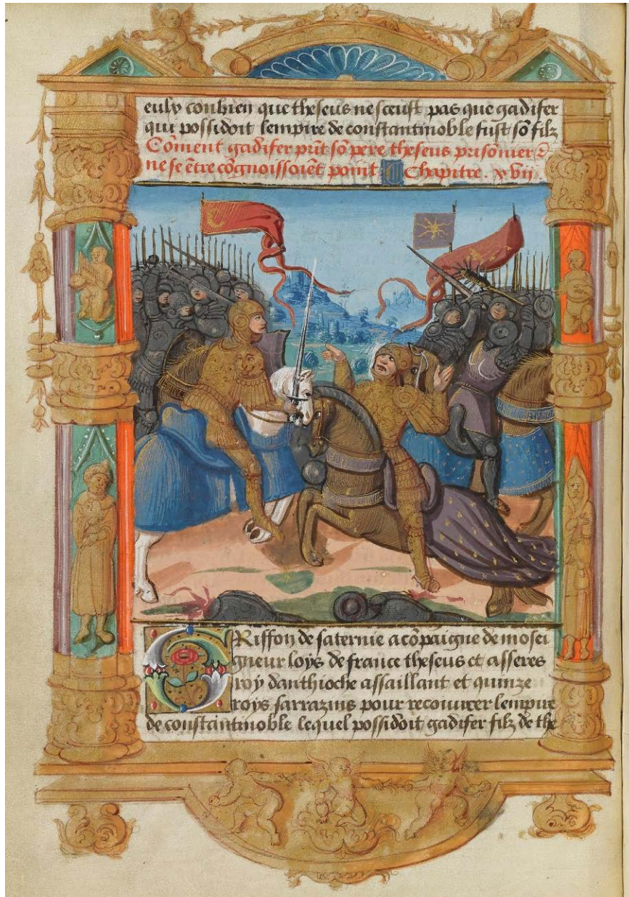
Ill. 9 : Gadifer combat son père Théséus ; BnF, fr. 1473, fol. 50