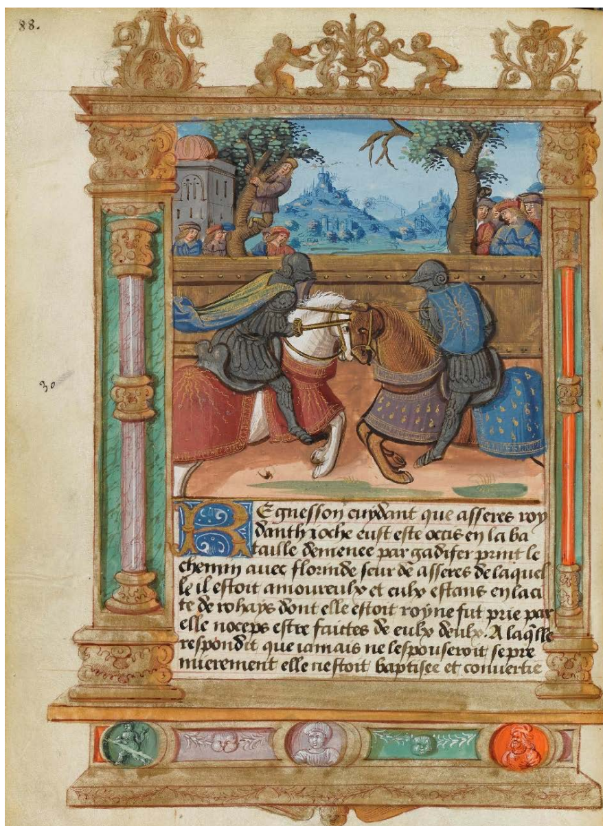
III. 8 : Regnsson et l'amiral de Jérusalem se battent en duel ; BnF, fr. 1473, fol. 88