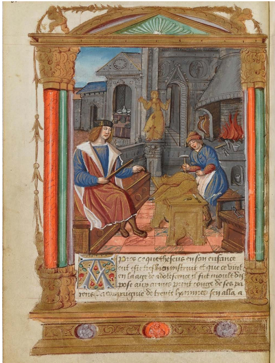
Ill. 4 : La confection de l'aigle d'or ; BnF, fr. 1473, fol. 6