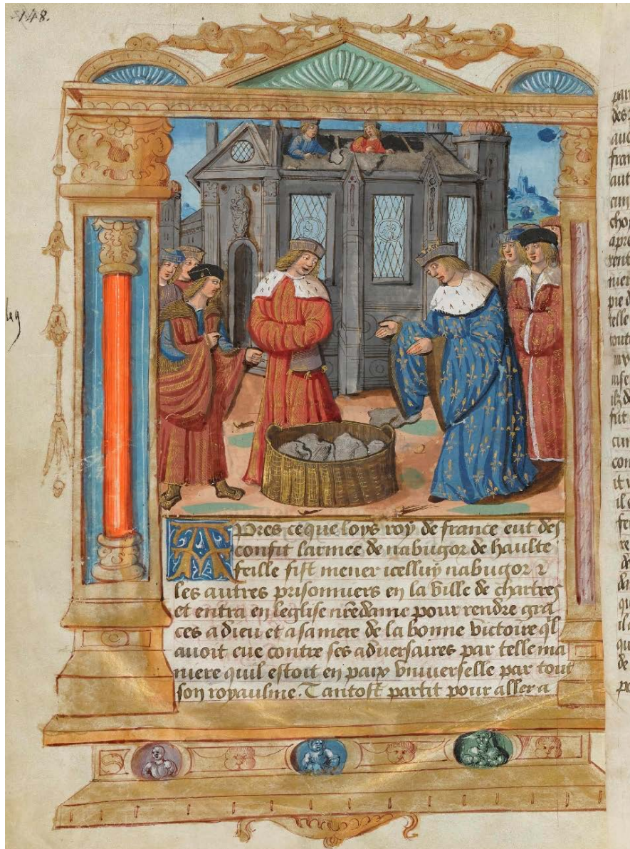
Ill. 7 : Le roi Louis déconstruit l'église Saint-Denis ; BnF, fr. 1473, fol. 148