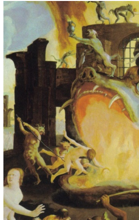
Figure 10 : Lucas de Leyde, « La bouche de l'enfer », partie du triptyque du Jugement dernier , 1526-27, Stedelijk Museum de Lakenhal