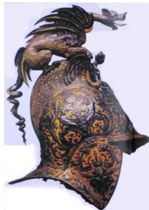
Figure 3 : Bourguignotte , Talie, XVI e siècle, musée de l'Armée, Paris