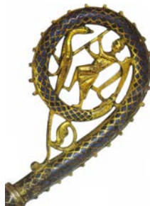
Figure 12 : Crosse avec saint Michel terrassant le dragon, Toul. XIII e , Nancy, émail champlevé. Musée lorrain