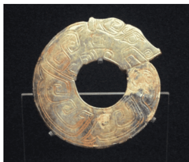
Figure 18 : Ouroboros , jade, musée Jinan, Chine, 2200-1700 av. J.-C.