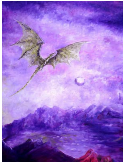
Figure 17 : Daisy Jauze, Envol du dragon , Huile/Papier, 2018