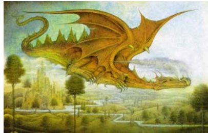
Figure 16 : Wayne Anderson, Dragon survolant un paysage , XX e siècle