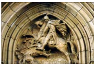
Figure 8 : Saint-Georges terrassant le dragon, tympan de l'église de Lyon