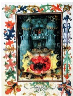
Figure 9 : La bouche des Enfers , Livre d'Heures de Catherine de Clèves (v. 1430-60), Utrecht, Pays-Bas