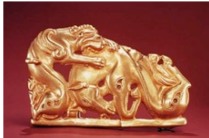
Figure 14 : Dragon attaquant un cheval . Plaque de ceinture scythe Sarmate en or et turquoise (VI e siècle av J.-C. - I er après). Musée de l'Hermitage St. Petersburg, Russie