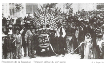
Figure 6 : Procession de la Tarasque , carte postale de 1905, édition Cournand, France