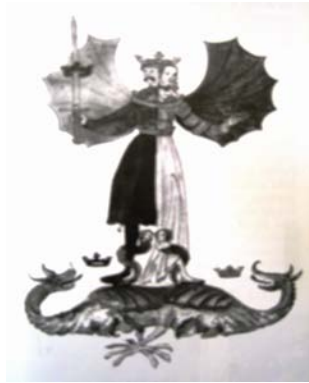
Figure 4 : Hermaphrodite couronné , manuscrit alchimique du XVII e siècle, bibliothèque de l'université de Leyde