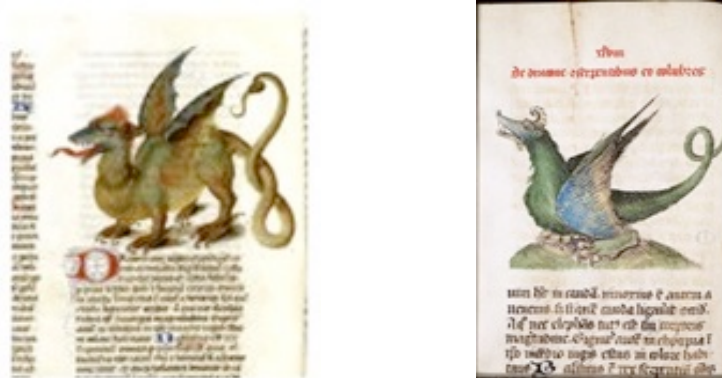
Figure 15 : Dragons in Liber Floridus de Lambert de Saint Omer, XII e siècle