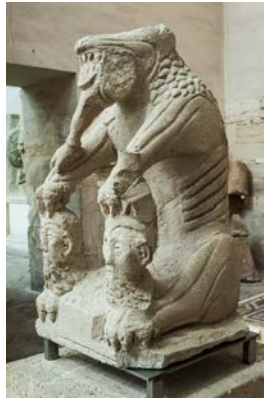
Figure 2 : La Tarasque de Noves , calcaire III-II e siècle av. J.-C., musée Lapidaire, fondation Calvet, Avignon