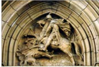
Figure 8 : Saint-Georges terrassant le dragon, tympan de l'église de Lyon