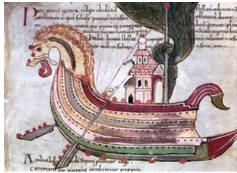
Figure 1 : Drakkar viking , enluminure, manuscrit anglo-saxon du X e siècle, British Museum, Londres