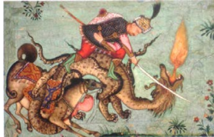
Figure 13 : Rustam à cheval contre un dragon , aquarelle iranienne, 1640-60, British Library, Londres