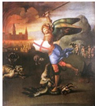
Figure 11 : Raphaël, Saint Michel contre le dragon , v. 1503-5, huile sur panneau, Louvre, Paris