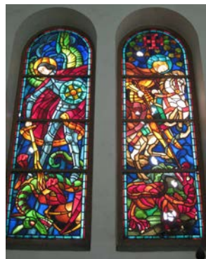
Figure 5 : Saint Michel et saint Georges , archétypes de la sauroctonie, vitraux de l'église de Saigon