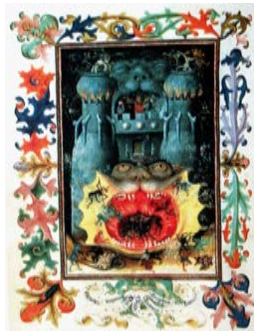
Figure 9 : La bouche des Enfers , Livre d'Heures de Catherine de Clèves (v. 1430-60), Utrecht, Pays-Bas