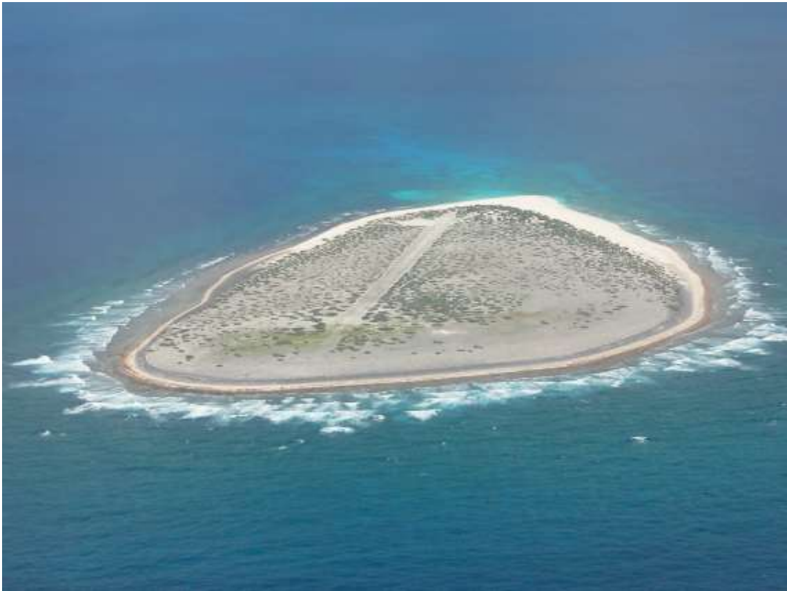
VUE AÉRIENNE DU RÉCIF DE TROMELIN