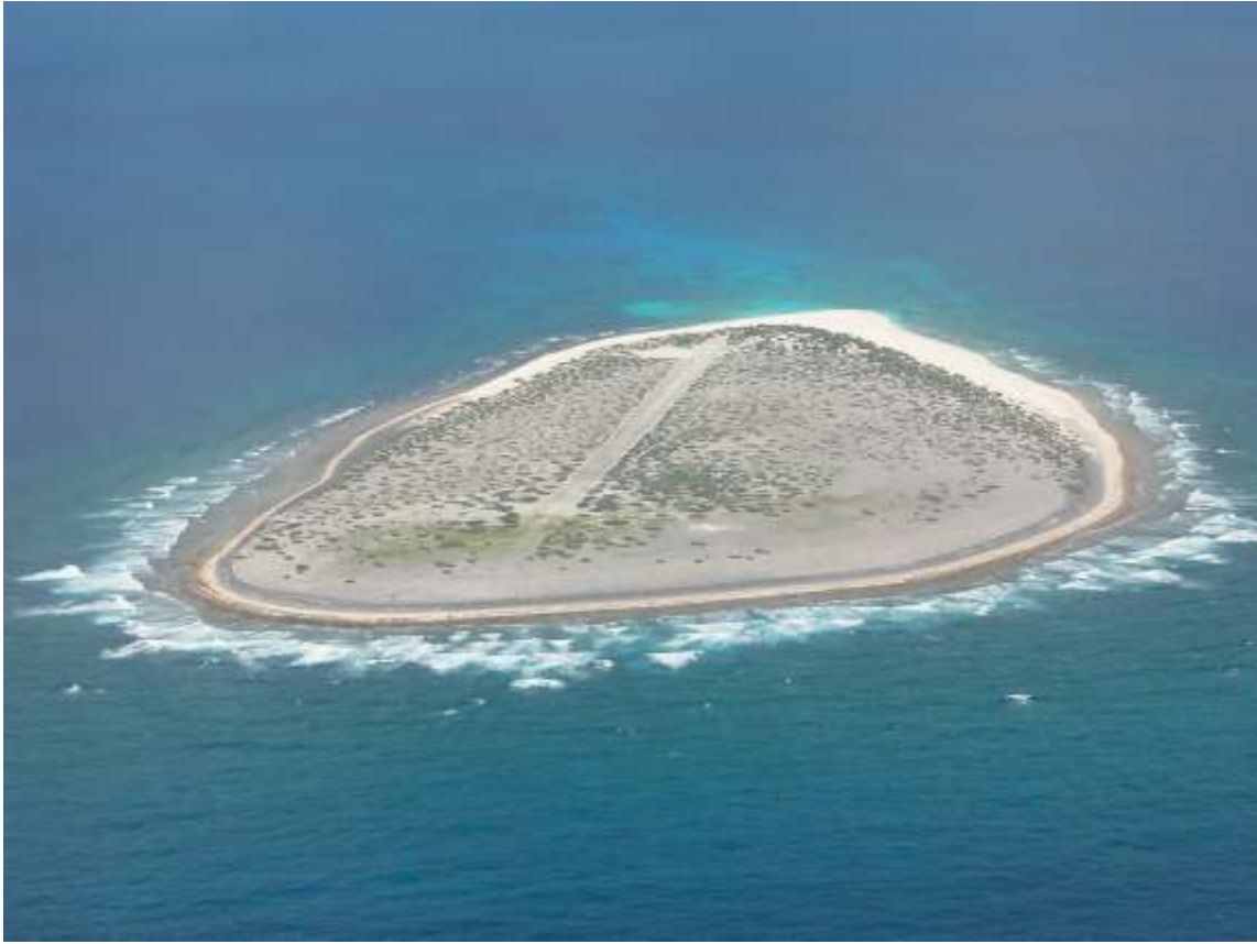
VUE AÉRIENNE DU RÉCIF DE TROMELIN