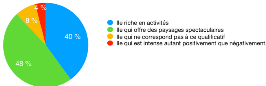
Fig. 1 - Résumé des réponses à propos de l'appellation « île intense »

Nous constatons que cette polysémie dont parle Barthes est bien présente. 88% des personnes sont d'accord avec l'utilisation de « île intense » pour qualifier l'île mais n'associent pas les mêmes caractéristiques à ce qualificatif : la plus grande partie (48%) évoque les paysages réunionnais et les autres (40%) pensent à la multiplicité d'activités possibles sur l'île. D'autre part, 8% des participants ne sont pas d'accord avec ce qualificatif. Ils estiment qu'il s'agit d'un « slogan » ou de « la spéculation ». Cela montre bien qu'une minorité de Réunionnais ressent l'exotisation de leur île. Enfin, 4% des individus expliquent que l'île est « intense » autant dans un sens négatif que positif avec une réponse comme : « intense pour ses paysages mais aussi pour sa météo qui peut être dévastatrice ». Ces 12% des personnes interrogées sont donc bien conscients de l'exotisme qui cherche à embellir, et par la même occasion, à ôter des esprits les aspects négatifs de l'île.