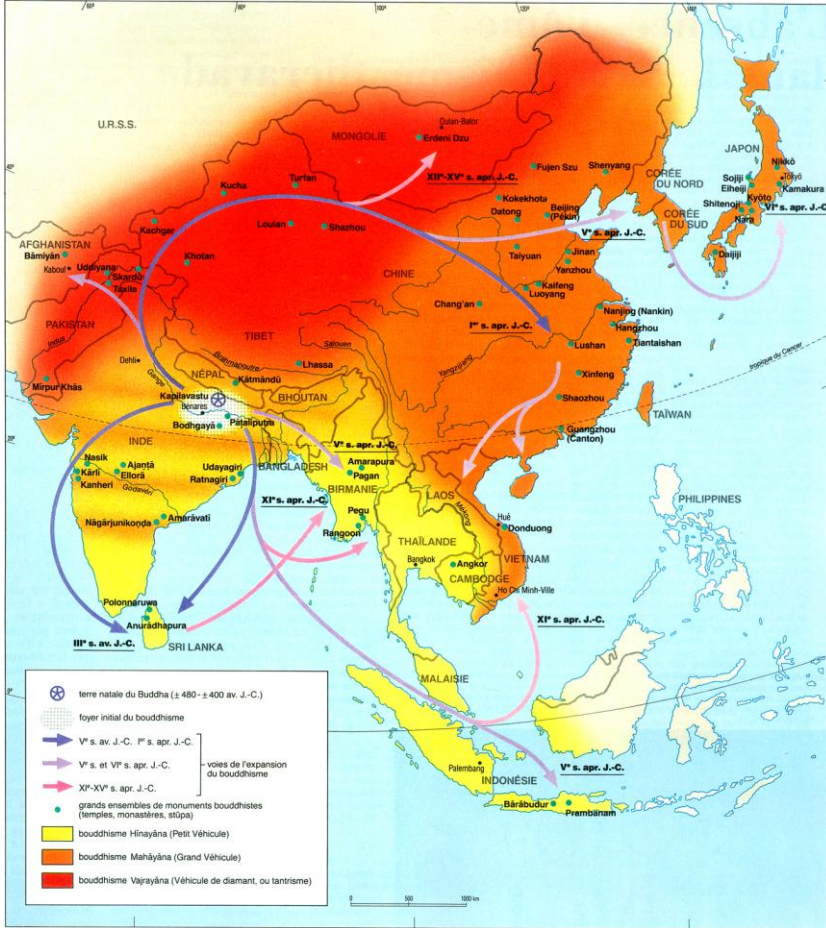
Source : Le Grand Atlas des religions , Encyclopædia Universalis, 1990, p. 355.