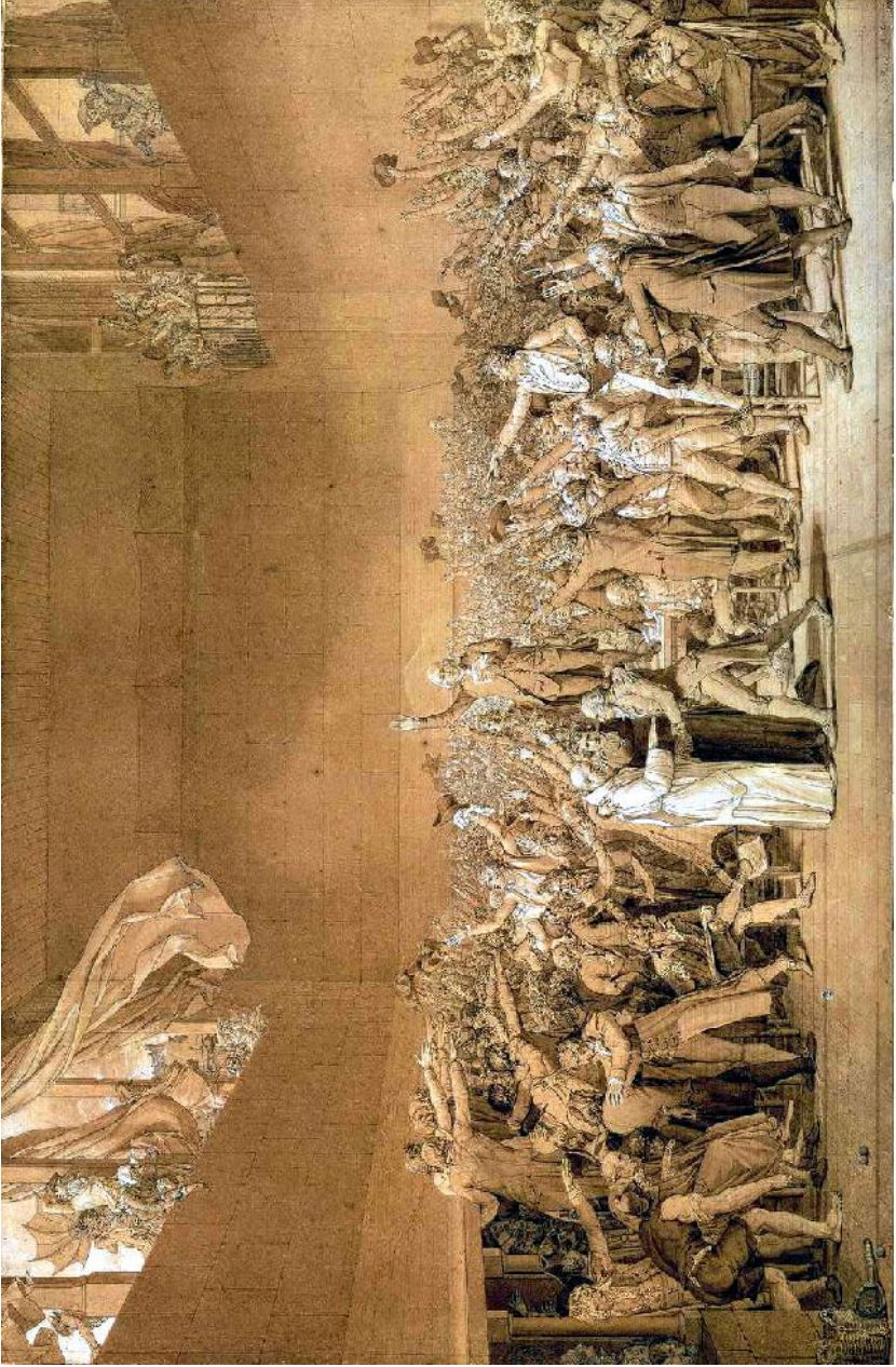
Le "Serment du Jeu de paume", de Jacques-Louis David.