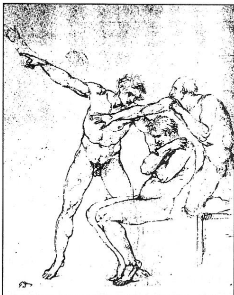
Étude pour le « Serment du Jeu de paume » (Bayonne, Musée Bonnat).

dire de Mourre 3 , c'est l'unique participant à la journée du 20 juin 1789 qui ait eu le courage de dire « non » à l'opinion générale unanime et exaltée, d'expliquer son refus malgré les menaces individuelles explicites et la pression plus sournoise du groupe, et de signer « opposant » en face de son nom.