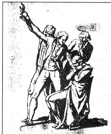
Extrait du « Carnet » de David (Versailles, Musée national du château).

Aussi, David, soucieux de préserver l'unanimité intellectuelle du « Serment », l'a-t-il représenté replié et honteux. Il semble en effet se repentir son vote et se cache aux regards. C'est un homme brisé de regrets qui est représenté ici et cette image vivante du remords sauve la valeur symbolique de l'unité du Tiers. La morale est sauvée.