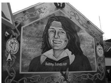
Photo 4 - Bobby Sand, gréviste de la faim, mort en 1981 Fresque Catholique, Belfast.

Bobby Sand fut le premier prisonnier à succomber face à l'intransigeance du gouvernement Thatcher, et la mort des dix grévistes de la faim en 1981 eut un retentissement considérable dans le monde entier. C'est sans doute en Irlande du Nord que l'impact de ces martyres a été le plus profond et suscita un mouvement nouveau : celui de la peinture, sur les murs, de ces héros morts pour la cause de leur communauté. Les fresques catholiques datent donc du début des années 1980.