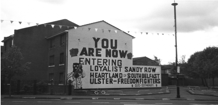
Photo 5 - Quartier Protestant de Belfast.

statut d'objet, plus précisément, d'artefact (Jarman, 3). Elle peut de fait remplacer un poste de surveillance, un garde, prêt éventuellement à ouvrir le feu sur les contrevenants, comme c'est le cas à l'entrée du quartier protestant de Belfast où même les trottoirs et immeubles sont peints aux couleurs de l' Union Jack :