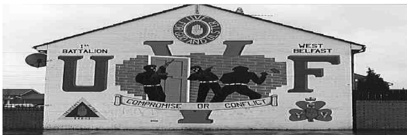
Photo 3 - Quartier Protestant, Belfast.

Ainsi, c'est en réalité la création d'une armée paramilitaire protestante, l'U.V.F, en janvier 1913, qui a inspiré la naissance de l'I.R.A, sur le même modèle (Hutchinson, 117).