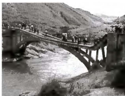
PONT DÉTRUIT À FATIHITA