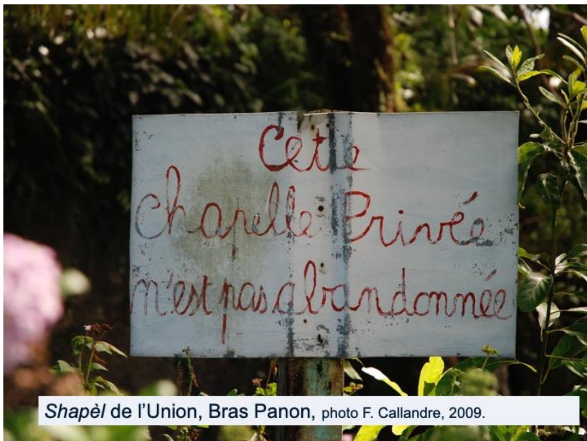
Shapèl de l'Union, Bras Panon, photo F. Callandre, 2009.