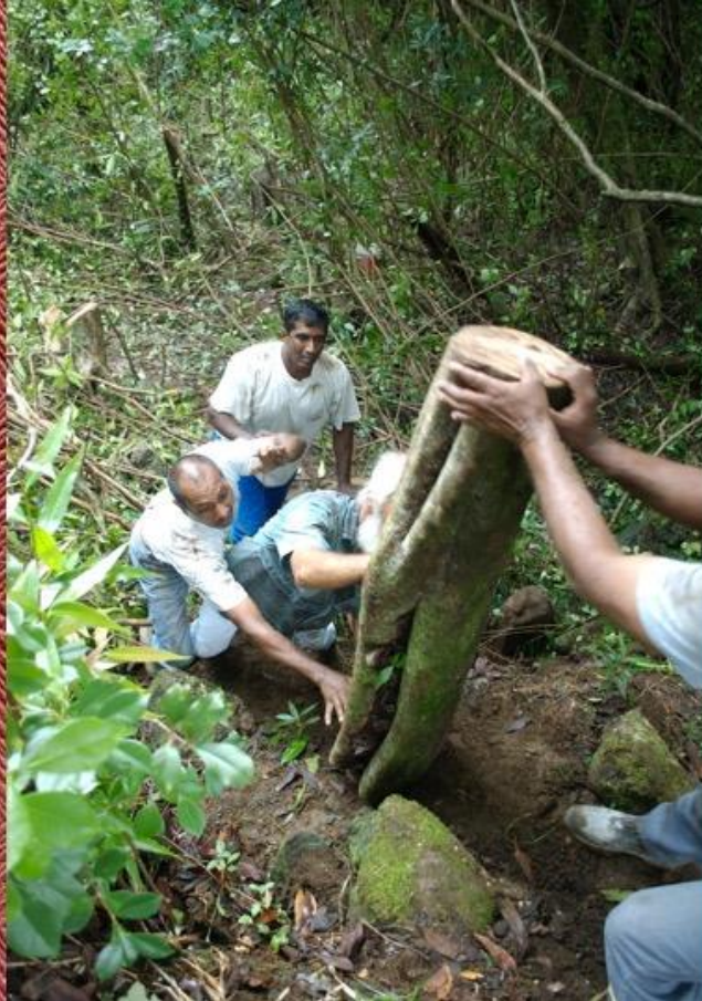
Décembre 2008

Découpage de bois dans la forêt Mourouvin pour la préparation de la marche sur le feu du koylou du Colosse.