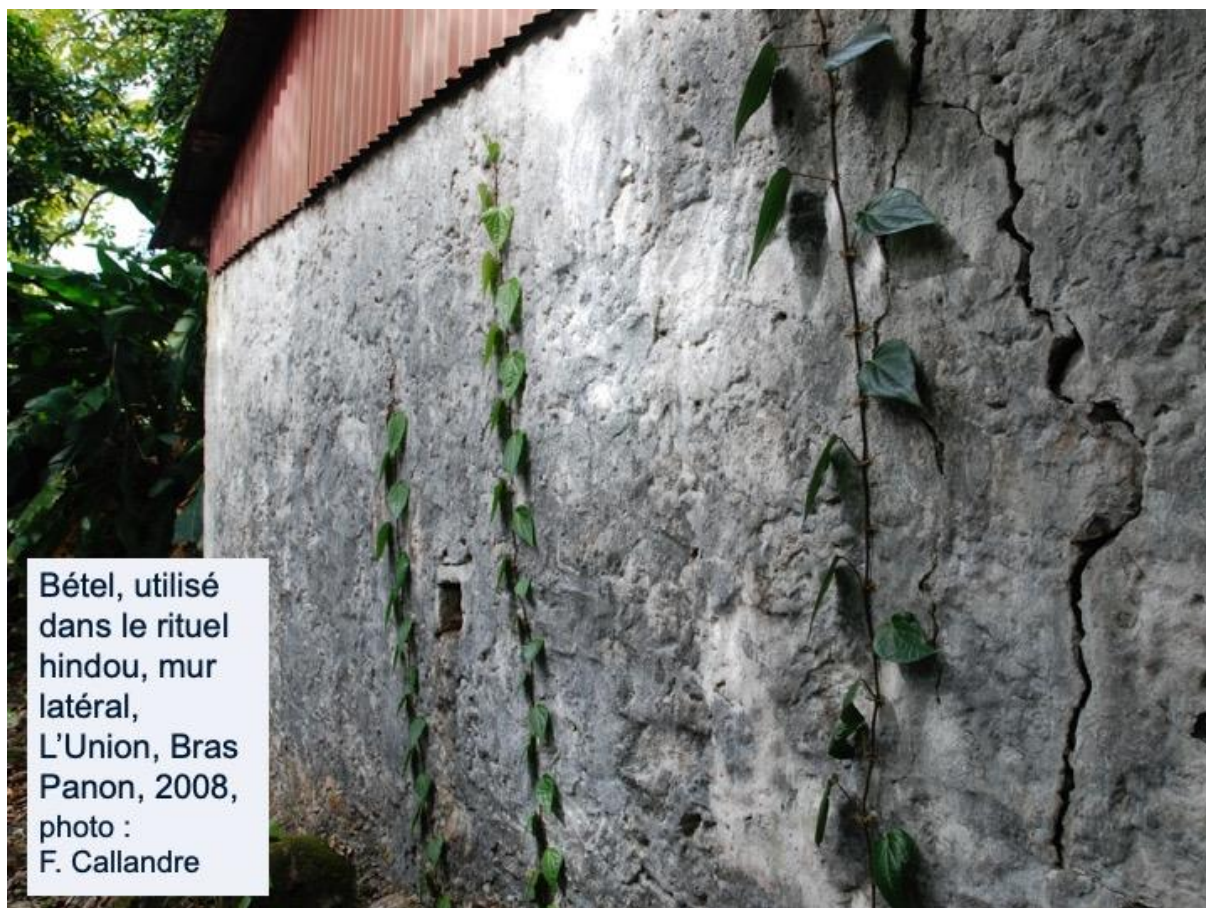
Bétel, utilisé dans le rituel hindou, mur latéral, L'Union, Bras Panon, 2008