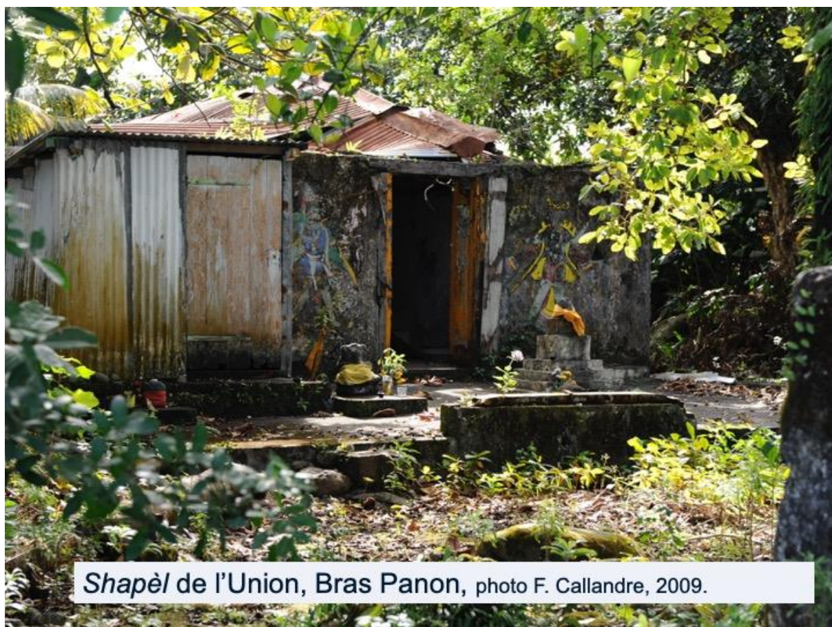
Shapèl de l'Union, Bras Panon