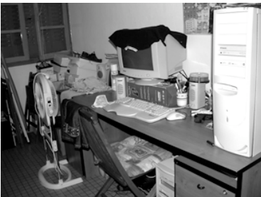
le « bureau-remise »