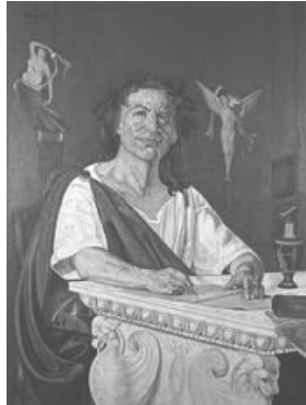
Ill. 1 – Horace

Le blanc a été retenu pour notre étude pour trois raisons : sa présence constante dans les Odes , sa richesse descriptive et sa signification morale et philosophique. Les trois Livres des Odes , Odarum seu carminum Libri , ont été composés par Horace (63-8) de 32 à 13 ; le quatrième et dernier Livre aurait été écrit sur l'instance d'Octave-Auguste.