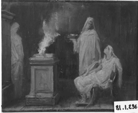
Hector Leroux , Les gardiennes du feu sacré. Verdun, Musée de la Prinerie, inv. 77. 82. V

En sus de la surveillance du feu sacré, elles devaient préparer la muries , une saumure sacrée servant à saler la mola, une farine qu'elles préparaient à jours fixes et qui sera répandue ( im-molare ) sur les animaux destinés au sacrifice 51 .