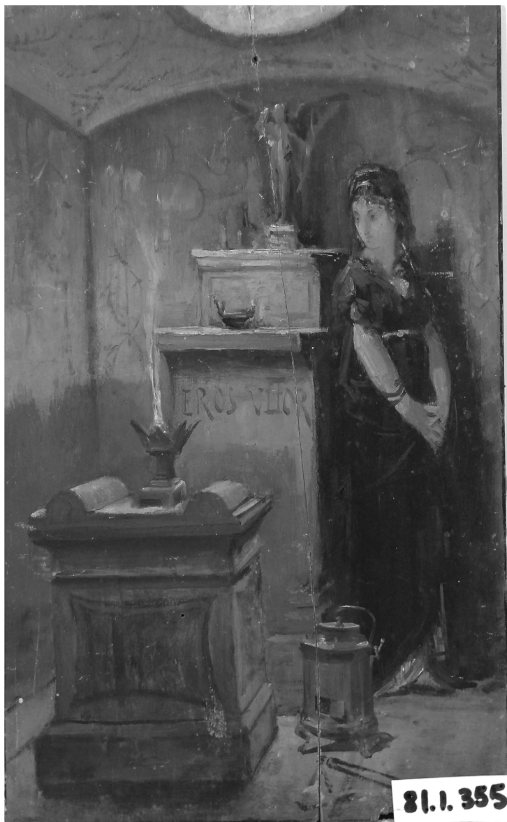
Hector Leroux , A l'amour vengeur. Herculanium , musée de la Prinerie, inv. 77. 142.