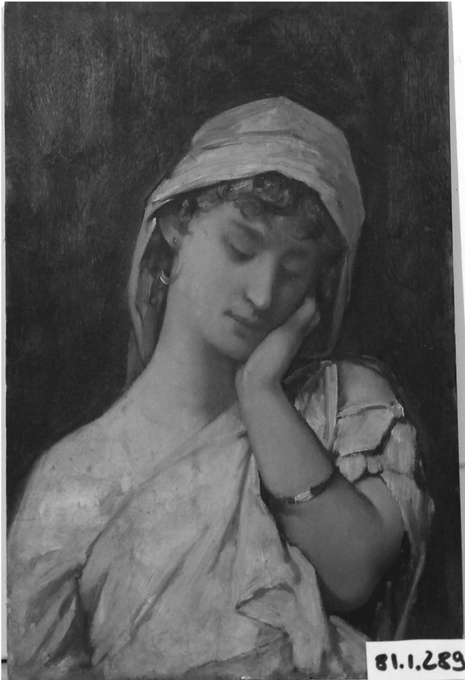
Hector Leroux , Etude pour une Vestale, musée de la Prinerie, inv. 81. 1. 289.

Les vestales de Leroux sont toutes de délicates jeunes filles accablées par la charge qui leur incombe. Les yeux baissés, la tête inclinée dans une attitude pensive, elles vivent à la lumière ténue de l'enceinte sacrée du temple, plongées dans des ténèbres quasi-éternelles, ravivant la flamme sacrée et accusées, trop souvent de faillir à leur devoir en s'abandonnant à leurs sens.