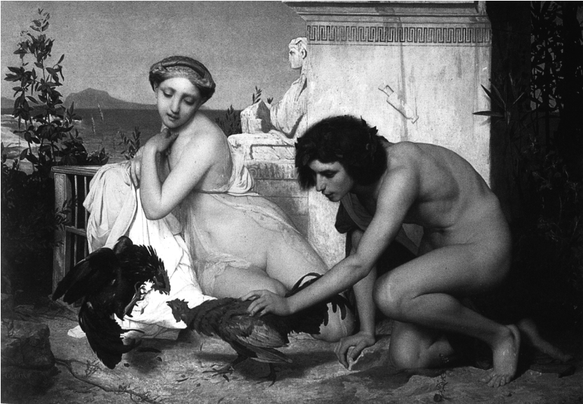
J. L. Gérôme, Jeunes Grecs faisant se battre des coqs . (Paris, Orsay, inv. RF 88).

Dans son commentaire du tableau il indiquait l'originalité et la force de l'œuvre par ces quelques mots : « Il faut du talent et de la ressource pour élever une scène épisodique au rang de composition noble » 11 .