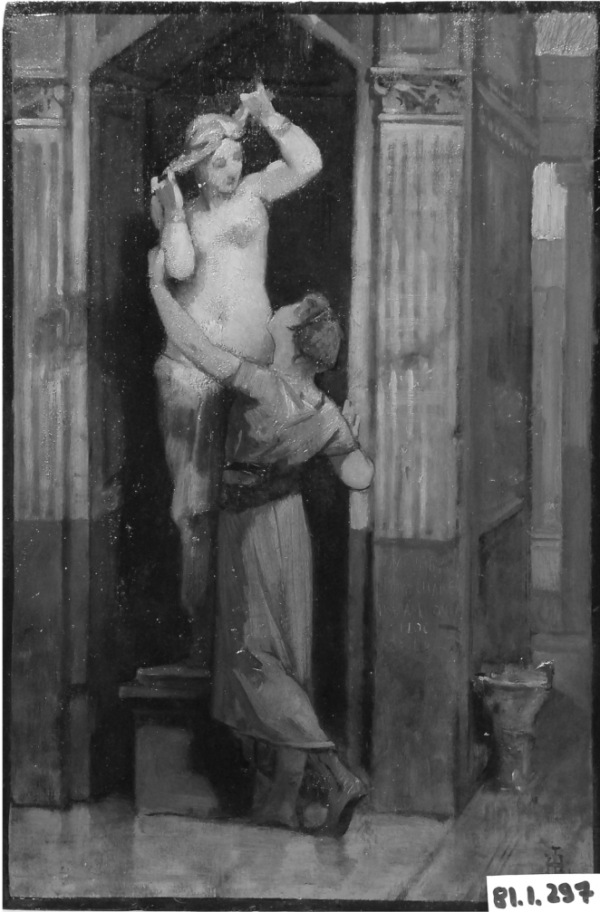
Hector Leroux , Un secret à Vénus pompéienne , Verdun, Musée de la Prinerie, inv. 77. 83.

ajouté au matériel archéologique déjà existant du Museo Prenestrino Barberiano ainsi que des découvertes récentes. Il y existe une véritable carence des sources sur les localisations et les circonstances des trouvailles dans les archives du Latium comme l'indique N. Agnoli, Museo archeologico nazionale di Palestrina. Le sculpture , Roma, l'Erma di Bretschneider, 2002, p. 7.