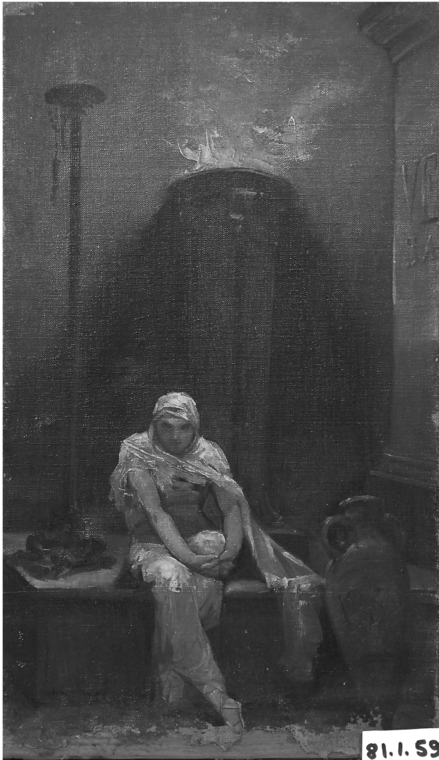
Hector Leroux , Mélancolie (esquisse non datée), Verdun, musée de la Prinerie, inv. 81. 59.

La mélancolie était un sujet littéraire fort répandu au XIX e siècle et auquel les poètes romantiques et notamment Chateaubriand auront apporté leurs lettres de noblesse. Ce thème a inspiré des artistes comme François André Vincent, en