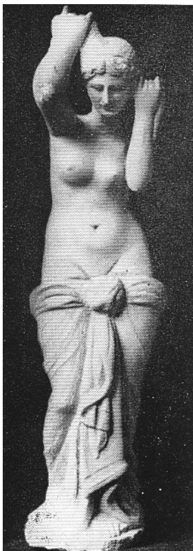
Naples , Museo nazionale, inv. MNA 126 248.