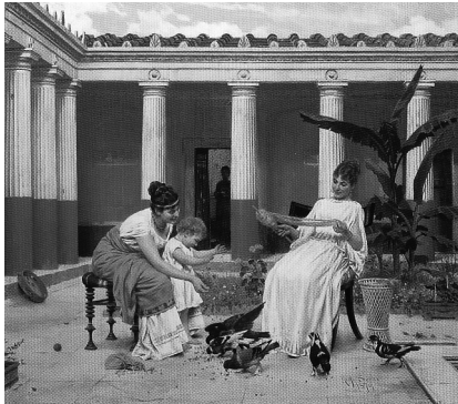
Raffaello Sorbi , Scena pompeiana , collection privée.

Si le réalisme n'arrive pourtant pas à dissimuler la supercherie : nous ne serons jamais à Pompéi avant 79 ap. J.-C mais dans une charmante reconstitution du XIX e siècle.