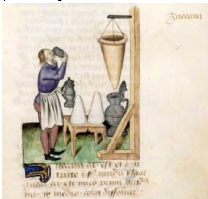
Raffinage et préparation du sucre. Tractatus De herbis , 1458, Modène, Biblioteca Estense ms lat 993, f°142r.

Mais déjà le miel se voit concurrencé par une autre douceur. Sur la rive nord de la Méditerranée, le sucre est cultivé en Sicile où pousse « la canne de Perse » 215 . Au XV e siècle, le sucre de l'océan Indien arrive à Alexandrie et Antalya 216 . La rencontre avec la culture arabe accélère une modification du goût au Moyen Âge. Le sucre de canne se substitue au miel, les agrumes prennent la place du vinaigre 217 .