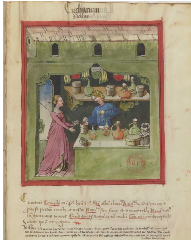
Le marchand de sucre. Ibn Buttân, Tacuinum sanitatis , Allemagne (Rhénanie), XV e siècle, Paris, BnF, département des Manuscrits, ms Latin 9333, f° 89r.

Dans les cours seigneuriales italiennes, les confiseries occupent une place de plus en plus considérable vers la fin du XV e siècle.