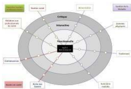
Figure 1 : étoile mettant en évidence les 8 variables et les 3 « niveaux »