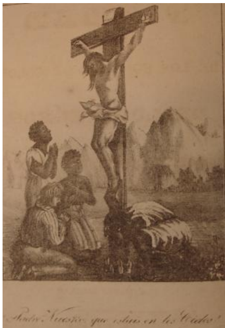
Première gravure, avant la page de titre « Notre Père qui êtes aux cieux »

La première illustration présente un groupe de quatre jeunes gens récitant le Notre Père au pied d'une croix. L'un d'entre eux est un Blanc, dont la présence serait problématique si elle ne signifiait l'unité de filiation entre les êtres humains défendue dans l'opuscule. En arrière-plan se trouve vaguement représenté un village de cases couvertes de chaume, d'aspect africain. Cette gravure, même si elle illustre pleinement le sujet, n'a bien sûr rien à voir avec la réalité haïtienne et encore moins argentine. Elle est à rapprocher des images d'Epinal de l'époque, peu soucieuses de vraisemblance. Il en ira de même