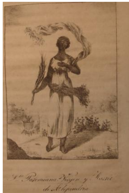
Seconde gravure « Sainte Potamienne. Vierge et martyre d'Alexandrie »

La première illustration présente un groupe de quatre jeunes gens récitant le Notre Père au pied d'une croix. L'un d'entre eux est un Blanc, dont la présence serait problématique si elle ne signifiait l'unité de filiation entre les êtres humains défendue dans l'opuscule. En arrière-plan se trouve vaguement représenté un village de cases couvertes de chaume, d'aspect africain. Cette gravure, même si elle illustre pleinement le sujet, n'a bien sûr rien à voir avec la réalité haïtienne et encore moins argentine. Elle est à rapprocher des images d'Epinal de l'époque, peu soucieuses de vraisemblance. Il en ira de même