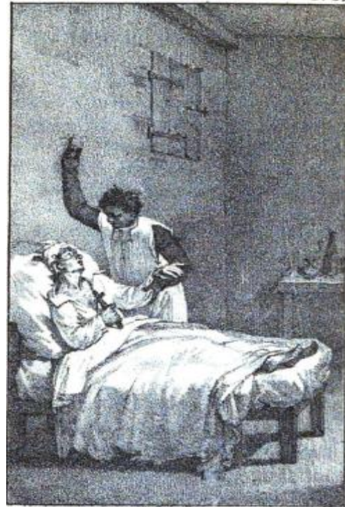
Un Esclave au lit de la mort. Donne la Liberté à ses Esclaves.

Cette gravure correspond à une idée obsessive de l'abbé Grégoire : l'assainissement des mœurs en Haïti, perverties par la prégnance du concept racial. L'absence d'une illustration semblable dans l'édition de Buenos Aires correspond au réalisme des éditeurs, conscients que la mentalité de la société dominante ne saurait accepter l'audace d'une telle proposition.