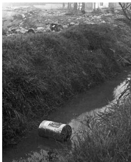
Contaminación de acequias en Valdejiervo, 1975.

Aragón 64 -, las cuales no solamente estaban compuestas por militantes de oposición, sino que llegaron a ser muy heterogéneas. Estas nuevas formas de protesta fueron conquistando el espacio público a través de manifestaciones, conferencias, seminarios, mesas redondas, charlas, pintadas, recitales, festivales de música, etc., más o menos legales. Pero también, y esta es el tratamiento que el propio Estado franquista les dio, ilegales (Anexo II).