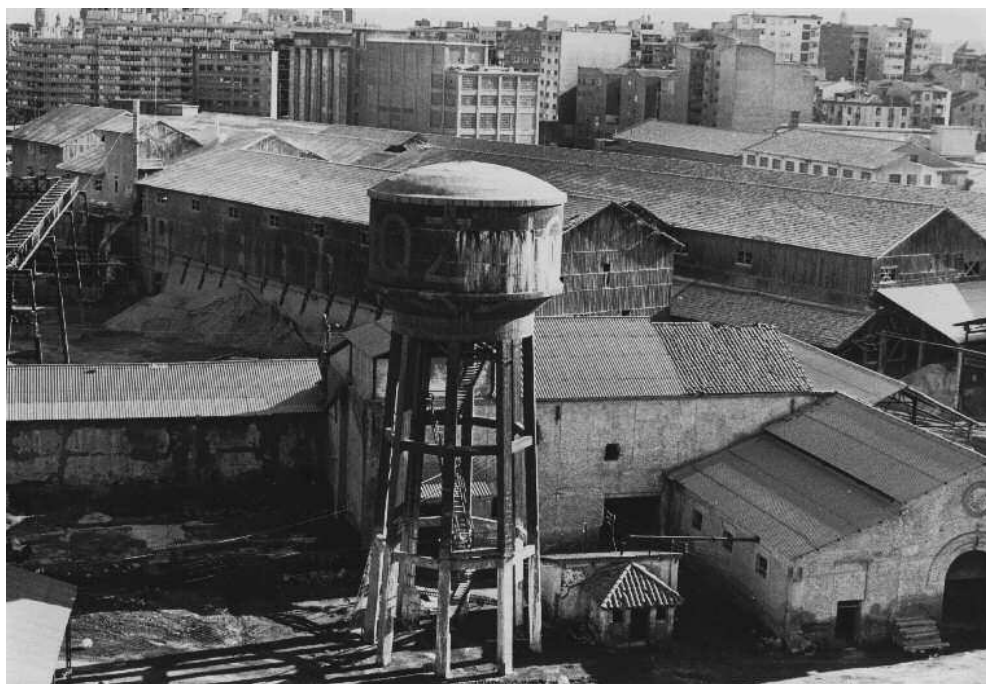
Industrias químicas en Zaragoza, 1975. Archivo Andalán.

Retóricamente, al régimen no le importó nunca ser acusado de perjudicar la salud de los españoles. Además, el mismo Instituto Nacional de Industria (INI) no tenía reparos en proclamar ante las denuncias de contaminación que velaba por la mejora de la calidad de vida nacional. Su general y presidente, Juan Antonio Suanzes, había afirmado respecto a la polución de las aguas que "no guían a este Organismo [INI], que naturalmente tiene que ser muy combatido por razón de su misma actividad, otros fines ni propósitos, seguidos de manera entusiasta, que los de lograr la regeneración material de nuestra Patria a través de las mejores condiciones de vida de nuestras gentes" 36 . El resultado de esta premisa dictada para toda la nación, fue que la Administración franquista nunca puso trabas a la industria contaminante durante estos años. Por dos razones: en primer lugar por el miedo a los conflictos laborales que desencadenaría el