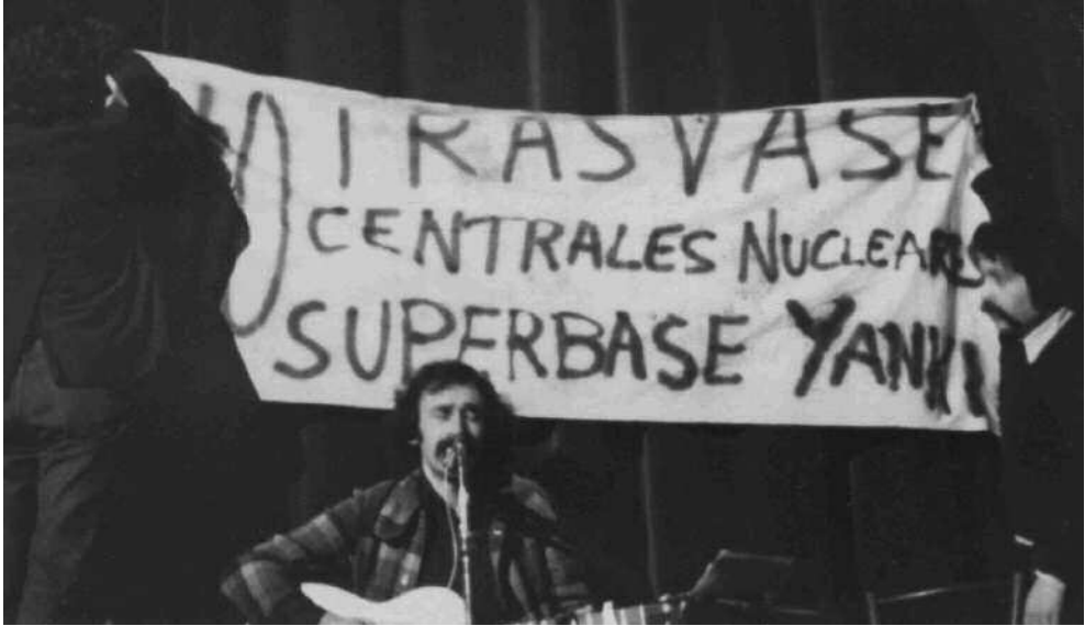
Recital de Joaquín Carbonel, 1976-1977.

industrialismo 43 y la institucionalización de la arbitrariedad como norma, se convirtieron en el abecé de la gestión ambiental durante la dictadura desarrollista. Elementos sin los cuales es imposible conocer la raíz de las protestas por cuestiones ambientales si existía una legislación tan prolífica al respecto –al contrario de lo que ocurrió con las protestas ambientales de épocas inmediatamente anteriores 44 .