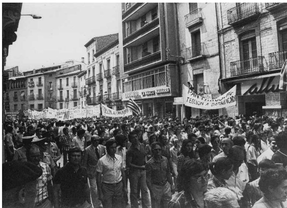
Manifestaciones en Huesca, 1976.

vecinos los que soportaban el peso del progreso de la nación (Corral, 2009a: 159-181). La percepción y la señalización de la injusticia estuvieron presentes en todos los escritos. El lenguaje empleado para describirla es el de "daños", "perjuicios" y "trastornos". Los habitantes de los pueblos apelaban, finalmente, al reconocimiento de sus "derechos" –expresados, al principio, de una manera individual, y de manera más colectiva conforme el conflicto se agravaba. Por eso, hacían referencia a la justicia de ser "recompensados" e "indemnizados" económica y moralmente. Puesto que ni querían dejar de ser agricultores –grandes o pequeños–, ni podían depurar las aguas o el aire sin ayuda del Estado. Tampoco querían emigrar a la ciudad, como pusieron en evidencia algunos de los ruegos de los Procuradores en Cortes sensiblemente afectados, como el siguiente: