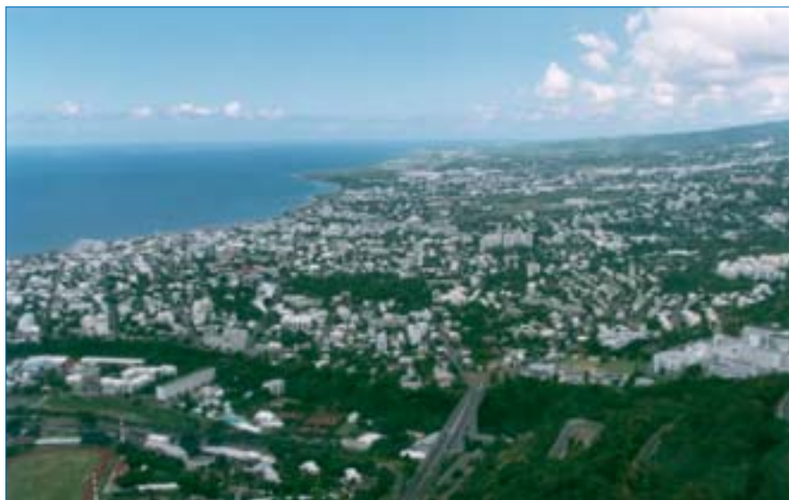
3. Saint-Denis. Ville tentaculaire dont les constructions résidentielles se lancent à l'assaut des premières pentes de l'arrière-pays (Le Brûlé, Saint-François, Bois-de-Nèfles, La Bretagne). La zone d'activité périurbaine (en arrière-plan) rejoint l'aéroport de Gillot, assurant le lien avec celle de la Mare (commune de Sainte-Marie).