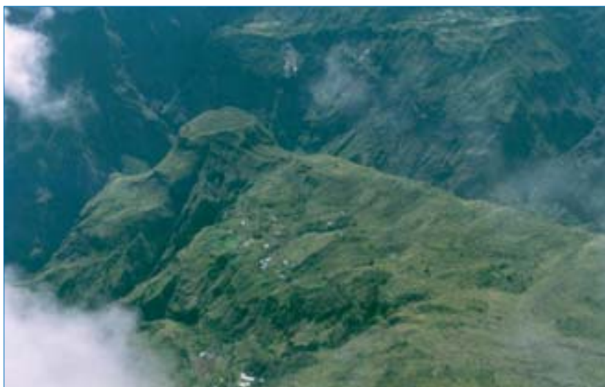
2. Intérieur du cirque de Mafate. L'habitat se regroupe dans les îlets, véritables nids d'aigle occupant le fond des cirques. Au premier plan, le village de Roche Plate, au second celui de La Nouvelle, séparés par les gorges de la rivière des Galets. L'hélicoptère demeure le seul moyen de desserte.

Dans cette nouvelle perspective, tout le reste du territoire apparaît alors comme un espace « périphérique », dont la dépendance est manifeste à plusieurs niveaux. Des 146 243 emplois recensés, 75 340 (52%) sont dans le « centre » ainsi délimité (4), soit 10% environ de la superficie insulaire. Ce Nord-Ouest réunit près de 70% des entreprises industrielles de l'île et 65% des activités tertiaires, dont presque toutes celles du niveau supérieur. Il compte 75% des commerces d'importation et de gros, 84% des établissements financiers et d'assurance. Il assure plus de 80% du produit touristique, devenu le premier de la Réunion avec une recette extérieure totale de 1 333 millions de francs. Il réunit aussi, sur une distance de 25 km, à la fois le seul port de commerce, par où transite tout le trafic maritime, l'aéroport international, et Saint-Denis, capitale politique et financière. Ces trois hauts lieux du système insulaire sont reliés par un réseau routier express. Toutefois, la partie mettant en relation Saint-Denis avec le port, la fameuse « route du littoral », la plus coûteuse de France, souffre d'être au pied d'une falaise relativement instable ; lorsque la route est coupée, toute la région orientale est paralysée et l'activité réunionnaise est alors au ralenti, ce qui souligne bien la dépendance du reste de l'espace à l'égard de la zone portuaire, véritable poumon de l'île.