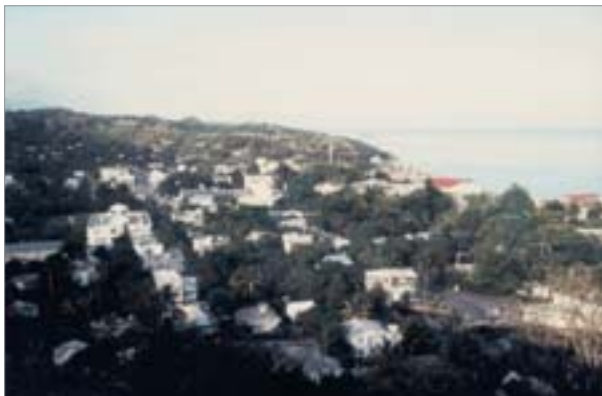
2. Port Mathurin, capitale lilliputienne enfouie sous la verdure, concentre toutes les fonctions vitales

à se suffire à elle-même. Cette situation s'explique par une diminution alarmante des ressources de son lagon qui ont été surexploitées, par le déclin de ses activités agricoles dans un milieu difficile (sécheresse, cyclones, fortes pentes, érosion des sols, etc.) et l'absence de moyens techniques et financiers, mais également par le désintérêt de Maurice à l'égard de ces 36 000 « nationaux de seconde zone ».