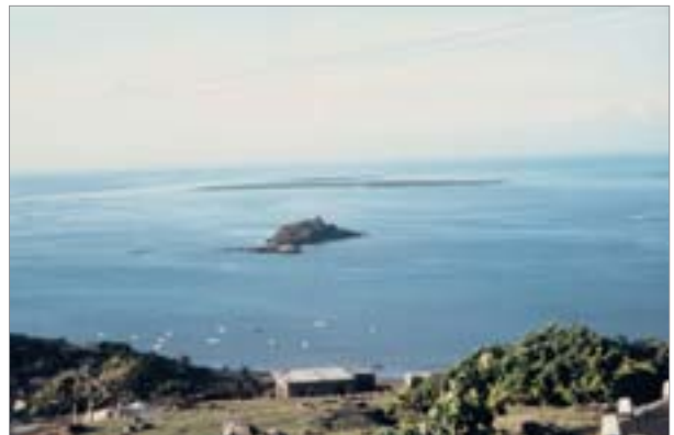
3. Son lagon de 200 km 2 représente aujourd'hui un important atout à valoriser dans sa politique touristique

à se suffire à elle-même. Cette situation s'explique par une diminution alarmante des ressources de son lagon qui ont été surexploitées, par le déclin de ses activités agricoles dans un milieu difficile (sécheresse, cyclones, fortes pentes, érosion des sols, etc.) et l'absence de moyens techniques et financiers, mais également par le désintérêt de Maurice à l'égard de ces 36 000 « nationaux de seconde zone ».