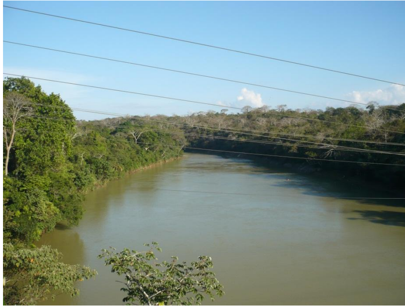
Une des petites rivières, débouchant près de Nombre de Dios, empruntées par les pirates anglais pour parvenir jusqu'aux camps ( palenques) des marrons.