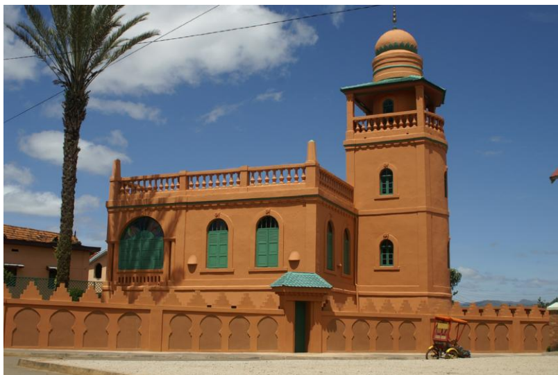
La mosquée d'Antsirabe en 2007.