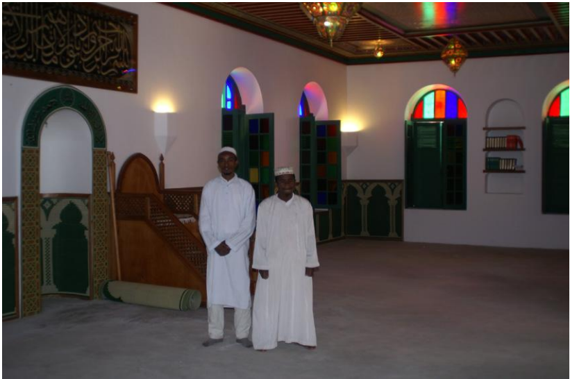
La mosquée d'Antsirabe. Aujourd'hui encore, c'est la communauté comorienne qui en a la charge.

Rien de plus naturel que cette relation entre frères d'une même religion, mais elle est source de suspicions pour les autorités françaises. Avant même l'arrivée de l'ex-sultan à Madagascar, les RG s'inquiètent : « Dans les milieux comoriens de Mahabibo (quartier de Majunga), le bruit court que l'ex-sultan du Maroc sera interné dans l'île de Mohéli (archipel des Comores). » 29 Difficile d'interpréter cette note qui reprend des rumeurs faites de demi-vérités. Elle révèle, comme nous le développerons plus tard, que la population de Madagascar n'est pas ignorante des affaires marocaines ni de la présence du sultan dans la région. Elle fait surtout apparaître que les autorités françaises sont hantées par le spectre d'un complot des musulmans de la Grande Île pour libérer Mohammed V, une obsession qui ne fait que commencer.