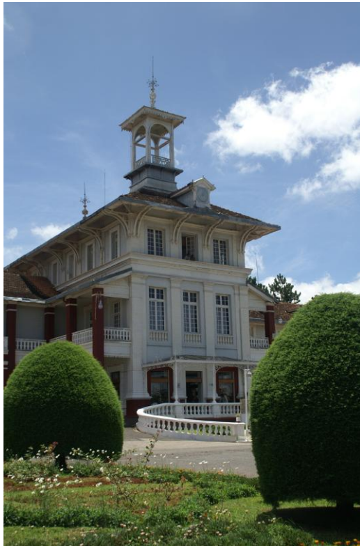
Hôtel des Thermes

Dans la précipitation, les exilés sont d'abord logés dans un centre d'accueil pour les familles de militaires dont le confort est rudimentaire. L'arrivée des autres membres de la famille (filles, femmes et concubines du sultan) ainsi que la perspective d'un séjour de longue durée à Madagascar, rendent nécessaire une solution plus confortable. Les travaux de réparation de l'hôtel des Thermes doivent s'achever en mars. Le sultan et sa suite en investissent alors l'une des ailes.