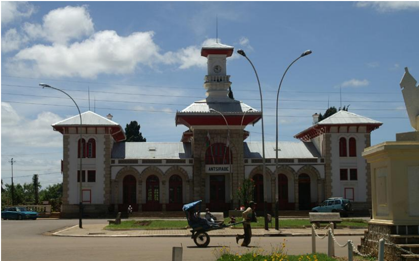
La gare d'Antsirabe

Plus rien n'empêche maintenant le départ de Mohammed V, qui s'était déjà vu signifier deux jours plus tôt, par le colonel Touya, la fin officielle de son exil. Le voyage pour la France est fixé au 28 octobre, le jour de la fête du Mouloud. Le sultan y voit un symbole pour les croyants : l'exil commença à l'Aïd el Kébir, il se termine pour l'anniversaire du prophète (Mais le départ sera repoussé au 30 octobre, pour raisons météorologiques).