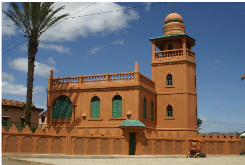
La mosquée d'Antsirabe en 2007.