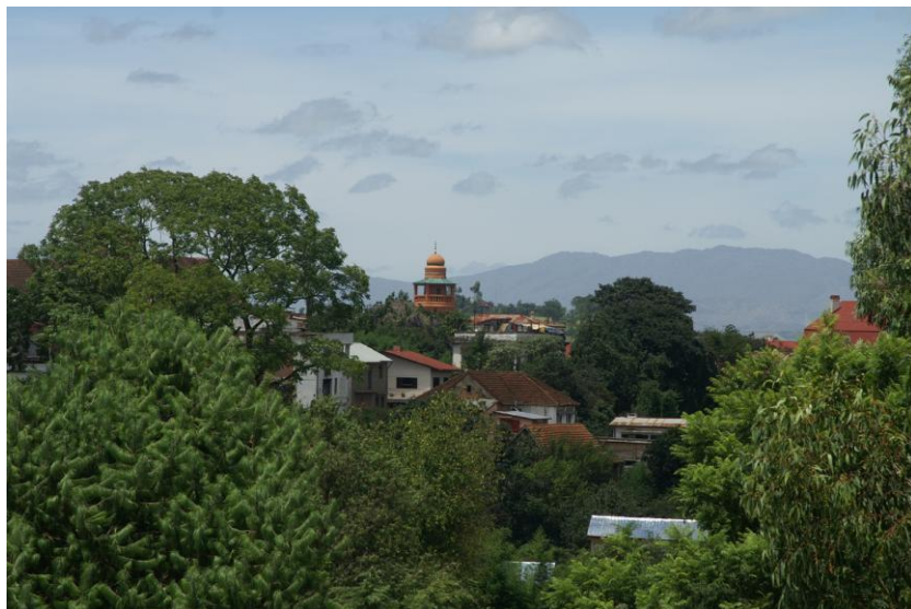
La mosquée d'Antsirabe vue de l'hôtel des Thermes

Edgar Faure est dans les mêmes dispositions. Il veut en finir avec le problème marocain d'autant qu'il sent que la majorité qui soutient les accords d'Antsirabe est très fragile. Maître de la manœuvre politique en régime parlementaire, il obtient, le 8 octobre, un vote favorable de l'Assemblée, au prix d'un décalage vers la gauche de sa majorité. Il a gagné son pari, mais se sait maintenant en sursis : il faut donc régler la question marocaine au plus vite 117 .