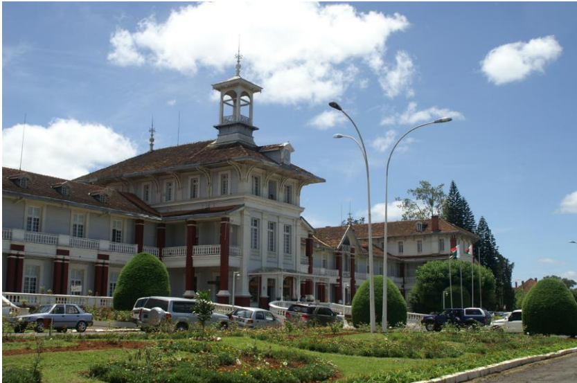
L'hôtel des Thermes en 2007

– "Naturellement, ils veulent leur indépendance et on ne peut leur donner tort..." » 110