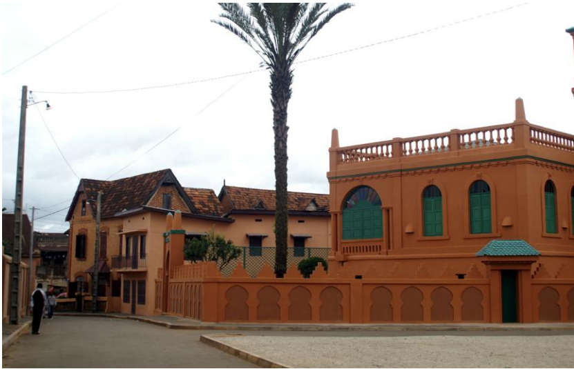
Antsirabe : la place Mohammed V et la mosquée.

En 1957, Mohammed V était de retour à Madagascar, faisant ressortir quelques vieux démons à Majunga où les autorités demandent instruction au haut-commissaire « en raison des commentaires que ce voyage ne manquera pas de susciter dans divers milieux » 126 . Pour le roi, il s'agit plus d'un pèlerinage. Il ne s'est jamais senti proche de la culture malgache, avouant même à Catroux ne pas être « passionné » par le retournement des morts, contrairement à son interlocuteur. Mais il sait qu'entre janvier 1954 et octobre 1955, plus qu'à Rabat, et peut-être même plus qu'à Paris, l'histoire de son pays s'est jouée à Madagascar.