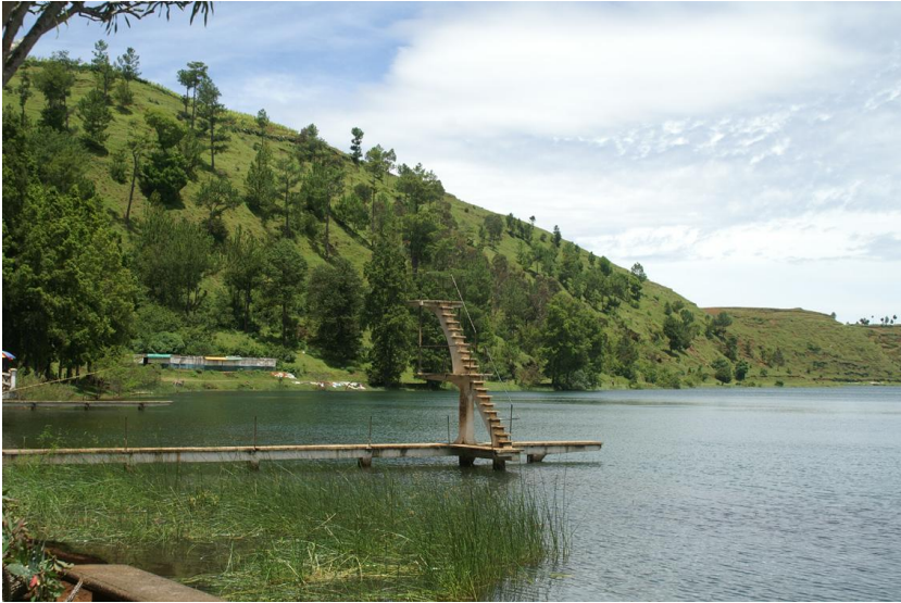
Le club nautique en 2007.

de rappeler le Malagasy Vaovao du 6 septembre 1955 42 , signalant d'ailleurs avec une certaine ironie que la presse métropolitaine souligne que leur départ procurera un certain soulagement pour la population. N'adhérant pas sans preuve à cette affirmation, le journal nationaliste s'engage à vérifier cette information auprès des Antsirabéens.