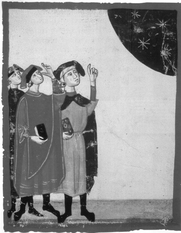
Fig. 3 : Nuova cronica de Giovanni Villani, f° 99r, la comète de 1264 ms. Chigiano I VIII 296, Bibliothèque du Vatican.

grands changements », la mort et la famine et « jamais les Florentins n'eurent tant de mal à gagner leur vie » 45 .