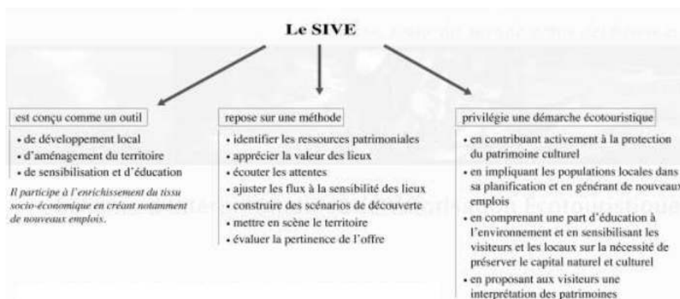
Figure 3. le SIVE en résumé...