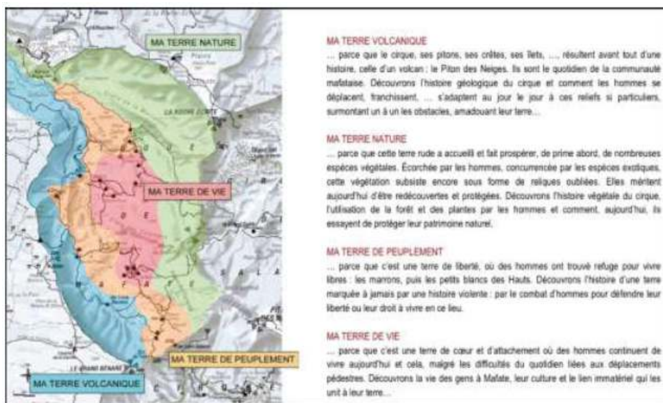
Figure 2. Déclinaison du thème central de Mafate, « ma terre, mes racines », aux quatre unités d'interprétation qui organisent la découverte et la valorisation écotouristique du territoire.