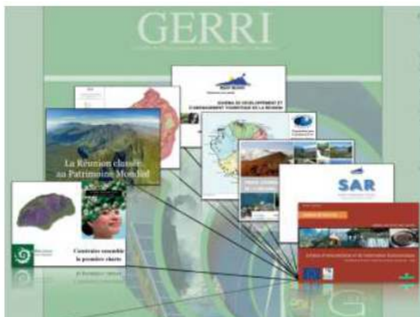
Figure 4. le SIVE, comme outil de connexion